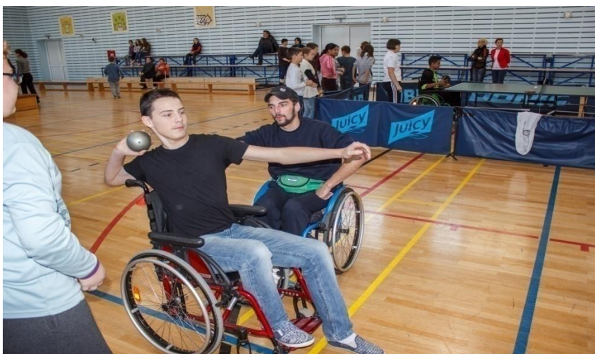
Slika 3: Učenik baca lopticu u dalj

U radu s učenicima s teškoćama u razvoju bitno je dobro upoznati pojedino dijete i voditi se mišlju da granice koje može prijeći pojedino dijete ne postoje – sve što dijete napravi u području svog tjelesnog razvoja sigurno će utjecati na unaprjeđenje zdravstvenog statusa (Trajkovski-Višić, Podnar i Mraković, 2010). Budući da neka istraživanja upućuju na to da se tjelesnim vježbanjem najviše može poboljšati kardiovaskularna izdržljivost djece s niskim motoričkim kompetencijama, a toj kategoriji pripadaju i neka djeca s lakšim teškoćama u razvoju (Hands, 2008), djeci to treba i omogućiti i stvoriti navike za redovitim vježbanjem, čak i onda kada nisu uključena u neke od grupnih programa tjelesnog vježbanja. Slika 3 prikazuje učenika u kolicima koji na nastavi Tjelesne i zdravstvene kulture baca lopticu.