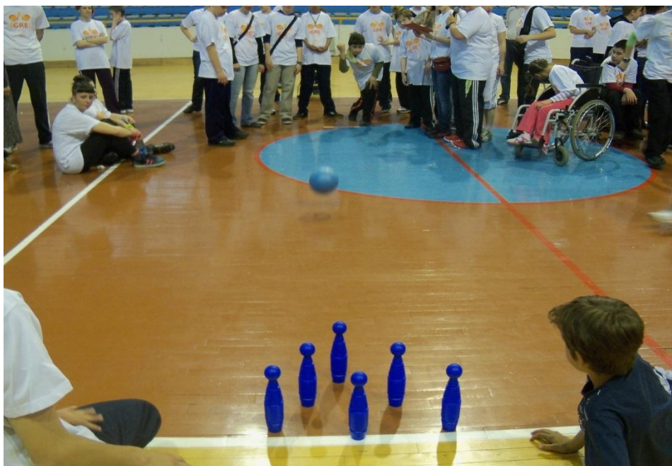
Slika 5: Učenici loptom gađaju čunjeve