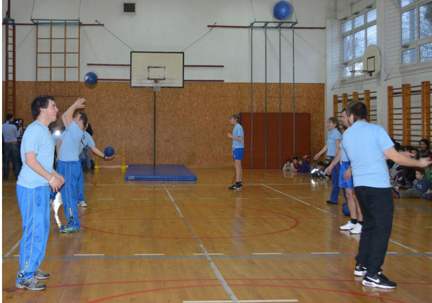
Slika 4: Učenici u igri s loptom

2013). Slika 3 prikazuje učenike s intelektualnim teškoćama koji se na nastavi Tjelesne i zdravstvene kulture dodavaju loptama.