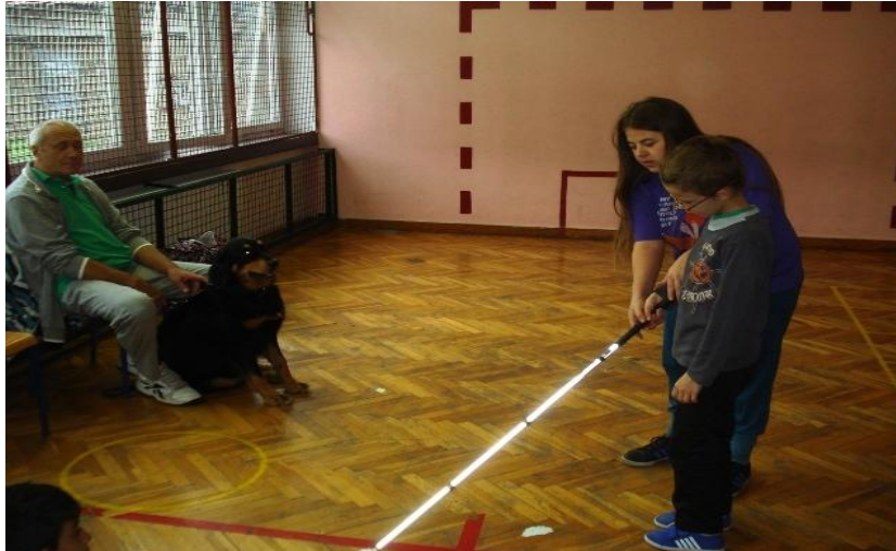
Slika 2: Učenik uči orijentaciju i kretanje s bijelim štapom

djecu iz redovnog obrazovanja a razlog tome su niska očekivanja, neadekvatni programi, nedostatna priprema profesionalaca u redovnom obrazovanju. Slika 2 prikazuje učenika s oštećenjem vida na nastavi Tjelesne i zdravstvene kulture.