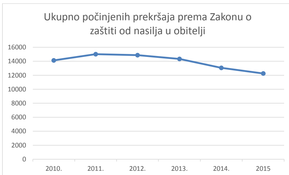
Slika 2. Ukupan broj počinjenih prekršaja prema Zakonu o zaštiti od nasilja u obitelji

Podaci preuzeti su iz statističkih pregleda temeljnih sigurnosnih pokazatelja i rezultata rada Ministarstva unutarnjih poslova Republike Hrvatske za razdoblje od 2010. do 2015. godine se odnose na prekršaje počinjene prema Zakonu o zaštiti od nasilja u obitelji (MUP RH 2010, 2011, 2012, 2013, 2014, 2015). Iz Slike 2. je vidljivo kako broj ukupnih počinjenih prekršaja kao i počinitelja istih opada u razdoblju od 2010. do 2015. godine odnosno 2010. godine taj broj je iznosio 14.129 dok je šest godina kasnije, 2015. godine ta brojka pala na 12.255.