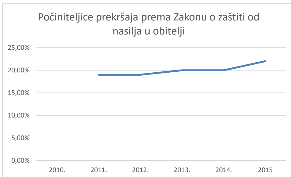
Slika 4. Ukupan broj počiniteljica prekršaja prema Zakonu o zaštiti od nasilja u obitelji

Zanimljivi su podaci vezani uz broj i postotak počiniteljica prekršaja (Slika 4.). Podataka o tome nema za 2010. godinu, no gledano za narednih pet godina pokazalo se kako njihov udio raste sa 19% za 2011. godinu na 22% za 2015. godinu (MUP RH 2011, 2012, 2013, 2014, 2015, 2016).