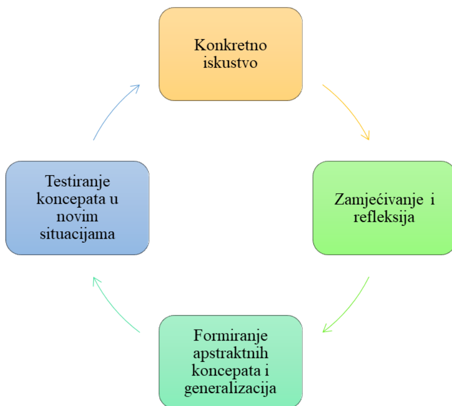
Slika 1. Prikaz Kolbovog cikličkog modela učenja (Kolb 1984, prema Vizek-Vidović i Vlahović Štetić, 2007).

Iskustveno učenje počinje od konkretnog iskustva do reflektivnog promatranja, zatim od apstraktne konceptualizacije do aktivnog eksperimentiranja (Dunlap i sur., 2008, prema Efstratia, 2014). Drugim riječima, u prvoj fazi učenik aktivno doživljava aktivnost. Druga faza je kada učenik svjesno razmišlja o tom iskustvu. Ova faza se sastoji od dvije podfaze: zamjećivanje i obrada zamijećenog tj. apstraktna konceptualizacija (Kolb, 1984). Zamjećivanje predstavlja podfazu refleksije u kojoj postavljamo pitanja o upravo doživljenom u odnosu na prijašnja iskustva. Pojedinaac reflektira na iskustvo pitajući se što se zapravo dogodilo, kako se on osjećao tijekom tog iskustva i koje značenje može pridodati doživljenom iskustvu. U sljedećem koraku slijedi obrada zamijećenog (apstraktna konceptualizacija). To je podfaza u kojoj učenik pokušava naći odgovore na ranije postavljena pitanja - generaliziranjem, zaključivanjem i oblikovanjem hipoteza o doživljenom. U trećoj fazi učenik pokušava dati