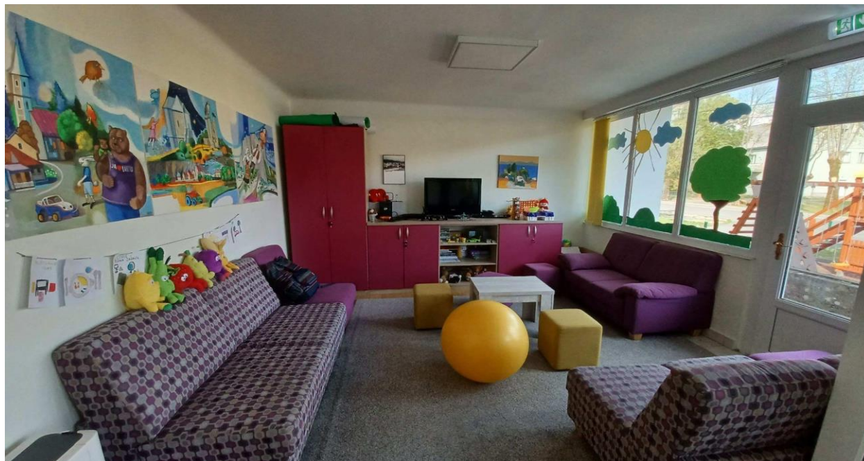
Slike 2.- 4.: prostor poludnevnog boravka u Brinju