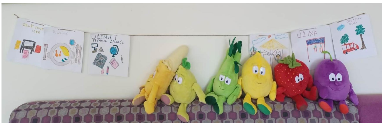
Slika 5: Raspored dana u poludnevnom boravku u Brinju

Grupu korisnika poludnevnog boravka u Brinju, s kojom su provedene doživljajno-pedagoške aktivnosti, sačinjavalo je 10 osnovnoškolaca, od čega većina pohađa 7. i 8. razred. Korisnici su u uslugu Poludnevnog boravka bili uključeni po odluci nadležnog Centra za socijalnu skrb, a najčešće po prijedlogu škole ili traženju roditelja. Zanimljivo je da su učenici 8. razreda bili uključeni u program poludnevnog boravka od samog njegovog početka djelovanja u Brinju, kao njegovi prvi korisnici.