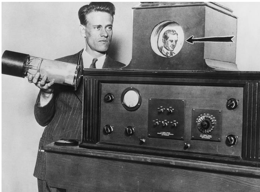
Slika 3. Prvi električni televizijski sustav, Philo Farnsworth

Revolucionarni izum javlja se 1927. godine kada je Philo Farnsworth demonstrirao prvi električni televizijski sustav te ga prijavio za patent (Slika 3). Farnsworth je razvio sustav koji se temeljio na električnom sustavu skeniranja i koji je postao osnova za razvoj televizije kakva se koristi i danas (Limburg, 2001). Zbog uspjeha u području razvoja televizije s pravom ga nazivaju „ocem televizije“, iako se usporedno s njegovim patentom javlja se i Vladimir Zworykin koji razvija opto-mehanički sustav. Danas se oba izumitelja mogu smatrati „očevima televizije“. Nešto prije, ali i nakon Drugog svjetskog rata započinje emitiranje televizijskih programa u boji (Forrester, 2020).