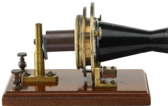
Slika 1. Prvi telefon, Alexander Graham Bell

Početak razvoja tehnologije obilježava izumitelj Alexander Graham Bell, koji je 1876. godine izumio vrijedni uređaj – telefon (Slika 1). Svrha prvog oblika telefona je sam prijenos govora elektroničkim putem (Grbavac, Grbavac i Krtalić, 2013). O početku Bellova razvoja komunikacije nema mnogo informacija, upravo iz razloga što se takav oblik komunikacije smatrao neučinkovitim, nedovoljno kvalitetnim i pretjerano skupim. Nadalje, postojali su brojni problemi u povezivanju, odnosno zadovoljavanju potražnje na tržištu i lociranju Bellovog sustava tamo gdje se potražnja razvila te samim time i slabije zadovoljstvo samom idejom telefona. Iz tog razloga, mnoge druge kompanije počele su duplicirati i reproducirati Bellov način komunikacije što je rezultiralo konkurencijom koja je imala lošiju kvalitetu u odnosu na Bellov proizvod. Dakle, iako su reproducirali Bellov proizvod nisu ga uspjeli usavršiti i učiniti učinkovitijim. Nakon tog razdoblja, slijedilo je razdoblje natjecanja nakon isteka Bellovog patenta. Gabel (1969) izvješćuje kako je tijekom 1893. i 1894. godine došlo do najbrže stope rasta usluga te do smanjenja naknada za telefonske usluge.