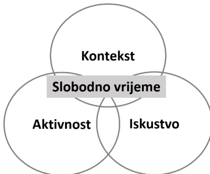
Slika 1. LACE model (Caldwell, 2011)

Jedan od načina razumijevanja razvoja mladih kroz slobodno vrijeme je iz perspektive „djelovanja u kontekstu“ (Silbereisen, i sur., 1986). Kroz perspektivu djelovanja u kontekstu nastoje se objasniti razlozi koji stoje iza izbora mladih, usredotočujući se na interakciju između aktivnosti u slobodno vrijeme, kontekst odvijanja aktivnosti i stečenih iskustva kroz sudjelovanje u slobodnim aktivnostima (Caldwell, 2011; Caldwell i Faulk, 2013). Model koji uzima u obzir aktivnosti, kontekst i kvalitetu doživljenih iskustva u slobodno vrijeme je LACE Model - Model slobodnih aktivnosti-konteksta-iskustva (eng. model Leisure Activity-Context-Experience ) (Caldwell, 2005; Caldwell, 2011) (vidi sliku 1). Upravo ovaj model pruža okvir za razumijevanje razvoja mladih u kontekstu slobodnog vremena (Belošević i Ferić, 2022a; Caldwell, 2005; Caldwell, 2011). LACE model pretpostavlja kako su slobodne aktivnosti, kontekst i iskustvo sudjelovanja u slobodnim aktivnostima međusobno povezani te da oni „u kombinaciji stvaraju uvjete koji ili služe za zaštitu mladih od negativnih ili rizičnih ponašanja ili promiču njihov pozitivan i zdrav razvoj“ (Caldwell i Faulk, 2013, str. 50).