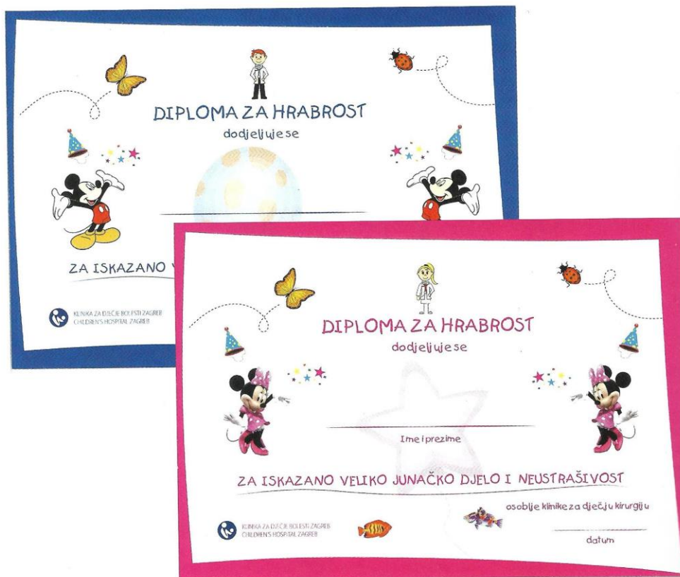
Slika 1. Primjer diplome za hrabrost (Filipušić i sur., 2020, str. 88)

Slike su stavljene uz dopuštenje autora.