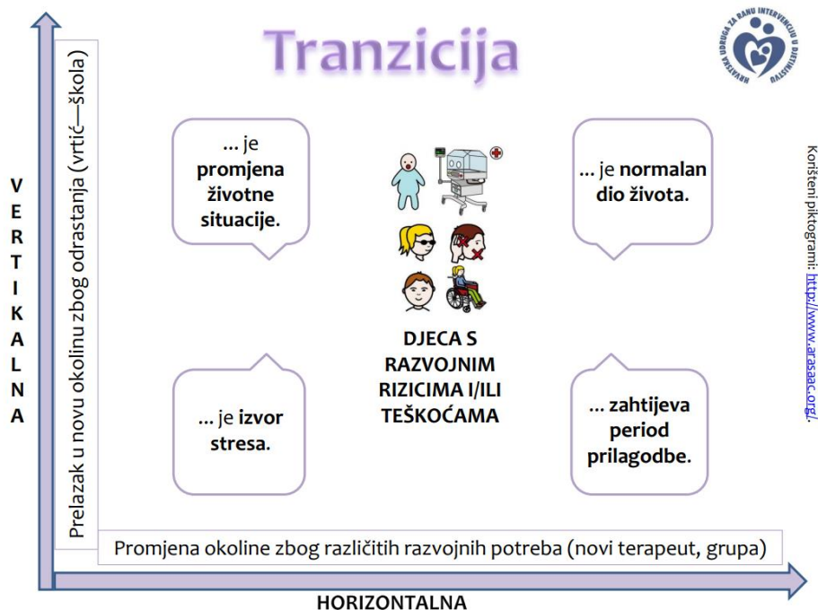
Slika 3. Internetski letak o prijelazu odnosno tranziciji namijenjen roditeljima djece s teškoćama („Hrvatska udruga za ranu intervenciju u djetinjstvu“[HURID], 2020)