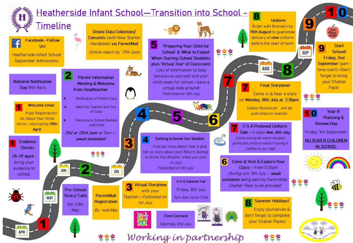
Slika 2. Primjer vremenske crte prijelaza u školu (Heatherside Infant School, 2022)

Kako je izdao Kalifornijski “Childcare health program” za uspješan prijelaz važne su sljedeće komponente: