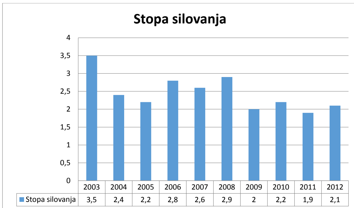
Grafikon 4. Stopa silovanja

Za period stupanja na snagu novog Kaznenog zakona, prema podacima MUP-a u Hrvatskoj je 2013. godine bilo 12 prijavljenih pokušaja silovanja, dok je u 2014.-oj brojka porasla na 21, što je porast od 75%. 2013. godine je prijavljenih silovanja bilo 82, dok je u 2014.-oj bilo 78 slučajeva prijavljenih silovanja što ukazuje na smanjenje od 4,9%. Kada je riječ o spolnom odnošaju bez pristanka, 2013. godine bila je 71 prijava, dok je 2014.-e bilo 70 prijava. U proteklih šest mjeseci 2015. godine, u RH je bilo 8 prijave pokušaja silovanja i 45 prijavljenih kaznenih djela silovanja (Ministarstvo unutarnjih poslova RH).