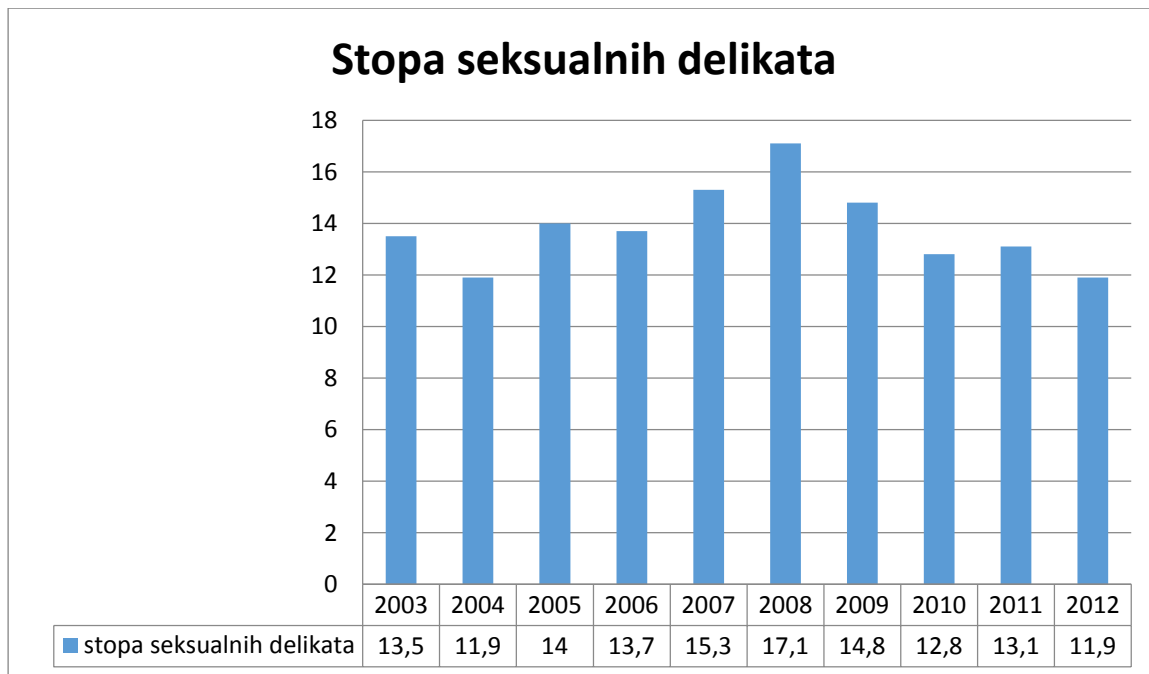
Grafikon 3. Stopa seksualnih delikata

Prema podacima iz Grafikona 3. stopa seksualnih delikata bila je najzastupljenija 2008. godine sa 17,1%, dok je u 2004. i 2012. sa 11,9 % najmanje zastupljen.