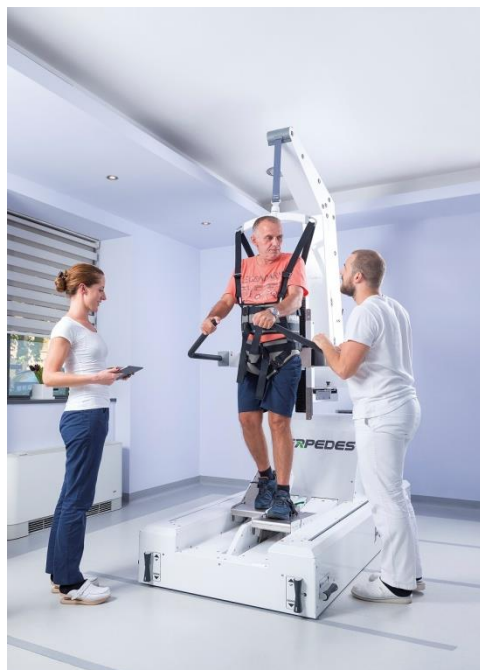
Slika 14. PerPedes robotski uređaj