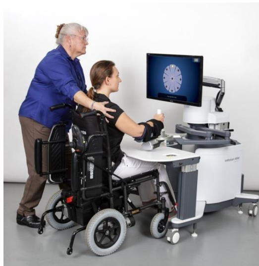
Slika 8. InMotion2 robotski uređaj

sliku te željene ishode neurorehabilitacijskog procesa, a uključuju povećanje samostalnosti prilikom izvođenja svakodnevnih aktivnosti, povećanje raspona pokreta, brzine i snage izvođenja pokreta te poboljšanje motoričkog planiranja, koordinacije oko ruka, snage, pažnje i koncentracije (Bayon i sur., 2016). Inmotion2 robotski uređaj programiran je na način da prati izvedbu osobe prilikom obavljanja određene aktivnosti te da pruža fizičku podršku u onoj mjeri u kojoj je to potrebno kako bi osoba uspješno dovršila zadatak. Potreba za pružanjem odgovarajuće razine podrške određuje se na temelju podataka dobivenih tijekom korištenja uređaja, a uključuju podatke o brzini izvođenja pokreta te vremena potrebnog za dovršavanje zadatka (Ibrahim i sur., 2022). Ukoliko osoba ne može samostalno izvesti zadatak, robotski uređaj pruža potporu pri njegovom rješavanju. S druge strane, Inmotion2 robotski uređaj pruža motivaciju i izazov te potiče osobu na izvođenje specifičnog pokreta ovisno o njegovim motoričkim sposobnostima (Duret i sur., 2015). Tijekom cijelog trajanja terapije, ovaj sustav zadaje specifične aktivnosti, nadzire pokrete osobe te pruža podršku kako bi uspješnost obavljanja zadataka i dostizanja ciljeva bila što veća.