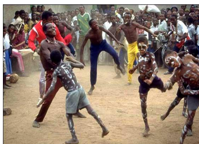
Slika 2. Prikaz plesne ceremonije