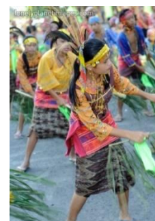
Slika 3. Prikaz plesne ceremonije