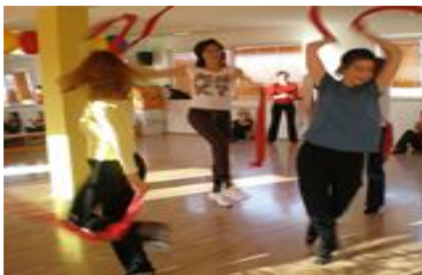
Slika 12. Prikaz improvizacije uz pomoć pribora ( http://www.plesnicentروسمijeh.com/edukativni_seminari.html )

materijali (slika 12) kao maske, baloni, bubnjevi i itd . Glavni fokus kod improvizacije jest razvoj kreativnost, samopoštovanje, pravo na izbor i razvoj osobnog stila. Kao što je navedeno, ono nije usmjereno prema terapijskom učinku, ali može biti.