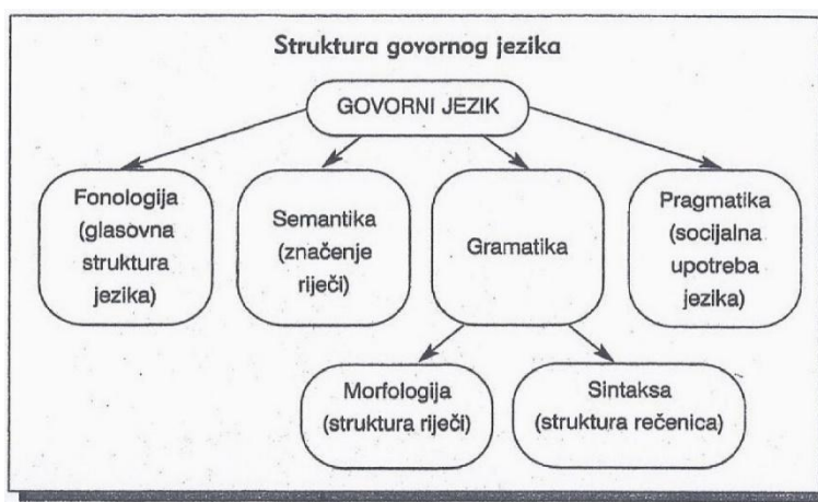
Slika 1: Struktura govornog jezika (Likierman i Muter, 2007)