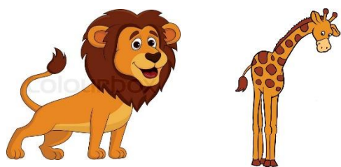
Slika 1. Primjer slikovno-tekstualnog prikaza priče