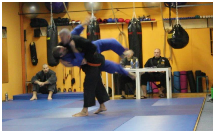
Slika 2 Demonstracija bočnih bacanja

Prilikom ispitivanja parternih tehnika ( ne waza ) N s partnerom demonstrira oslobađanje iz zahvata, ali dolazi do nesporazuma oko završavanja tehnike te se kroz dijalog s trenerom pojašnjavaju nejasnoće.