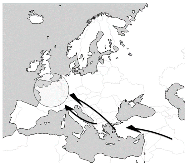
Slika 1: Balkanska ruta