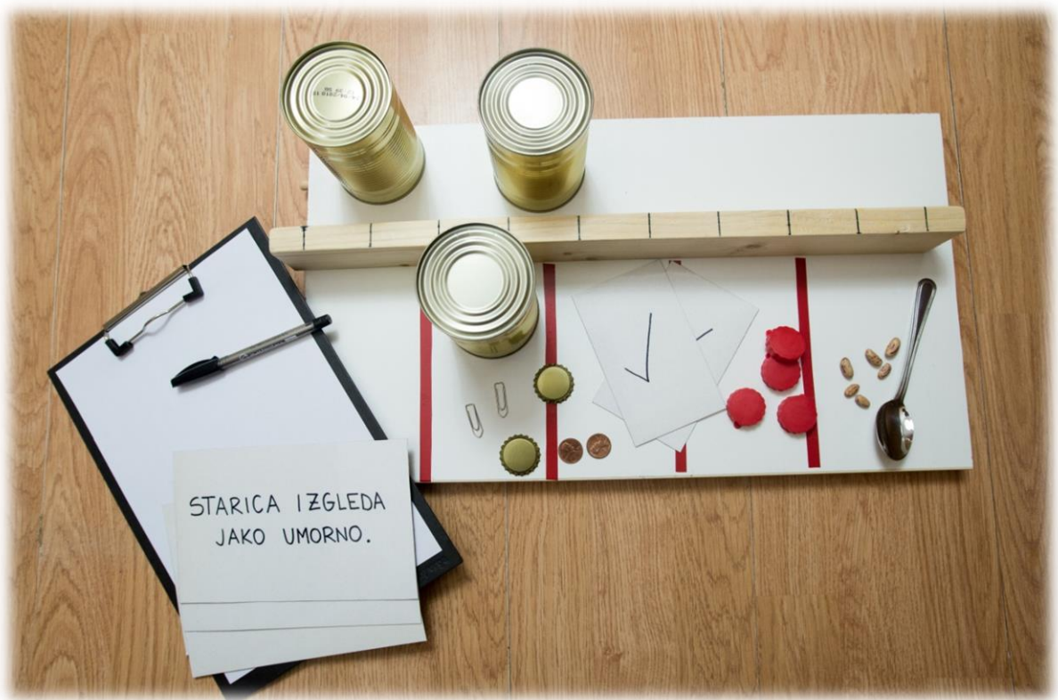
Slika 2 Jebsen Hand Function Test

Bodovanje se vrši tako da se bilježe sekunde potrebne za dovršavanje svakog od sedam zadataka. Duže vrijeme potrebno za dovršavanje svih zadataka upućuje na sniženu funkcionalnost ili onesposobljenost ruke koja se procjenjuje (Hackel i sur., 1992). Maksimalno vrijeme dozvoljeno za svaki subtest iznosi 120 sekundi (Duncan i sur., 1998, prema Beebe i Lang, 2009). Za provođenje testa je potrebno 10-15 minuta (Poole, 2011, prema Carr i sur., 2015), a sastoji se od jednostavnih, jeftinih i lako dostupnih materijala (Hackel i sur., 1992). To je pouzdan instrument za praćenje promjena u motoričkoj funkciji ruku tijekom liječenja (Carr i sur., 2015).