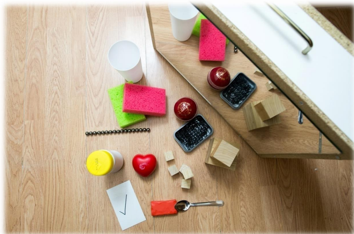
Slika 4 Zrcalo i rekviziti za vježbe