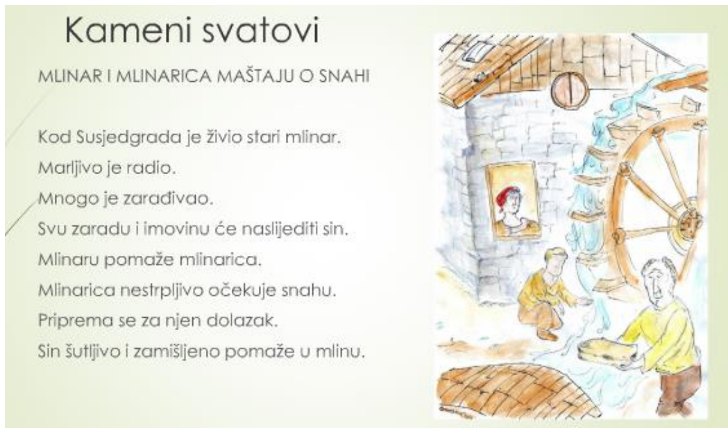
Slika 4. Primjer prilagodbe ulomka Mlinar i mlinarica maštaju o snahi iz narodne priče Kameni svatovi (iz lektire Povjestice Augusta Šenoe)

Važno je spomenuti i kako postoje školski udžbenici i čitanke namijenjeni za učenike s posebnim odgojno-obrazovnim potrebama koji sadrže tekstove i lektire pisane u obliku građe lagane za čitanje. Uz takve udžbenike i čitanke nerijetko dolaze i zvučni CD-i koji prate njihov sadržaj. Neki od primjera takve čitanke su Moj svijet riječi 5 i Moj svijet riječi 6 autorica Draganić, Ružić i Stančić. (alfascript.hr, 2016).