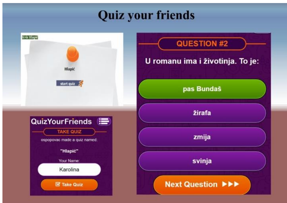
Slika 2. Quiz your friends