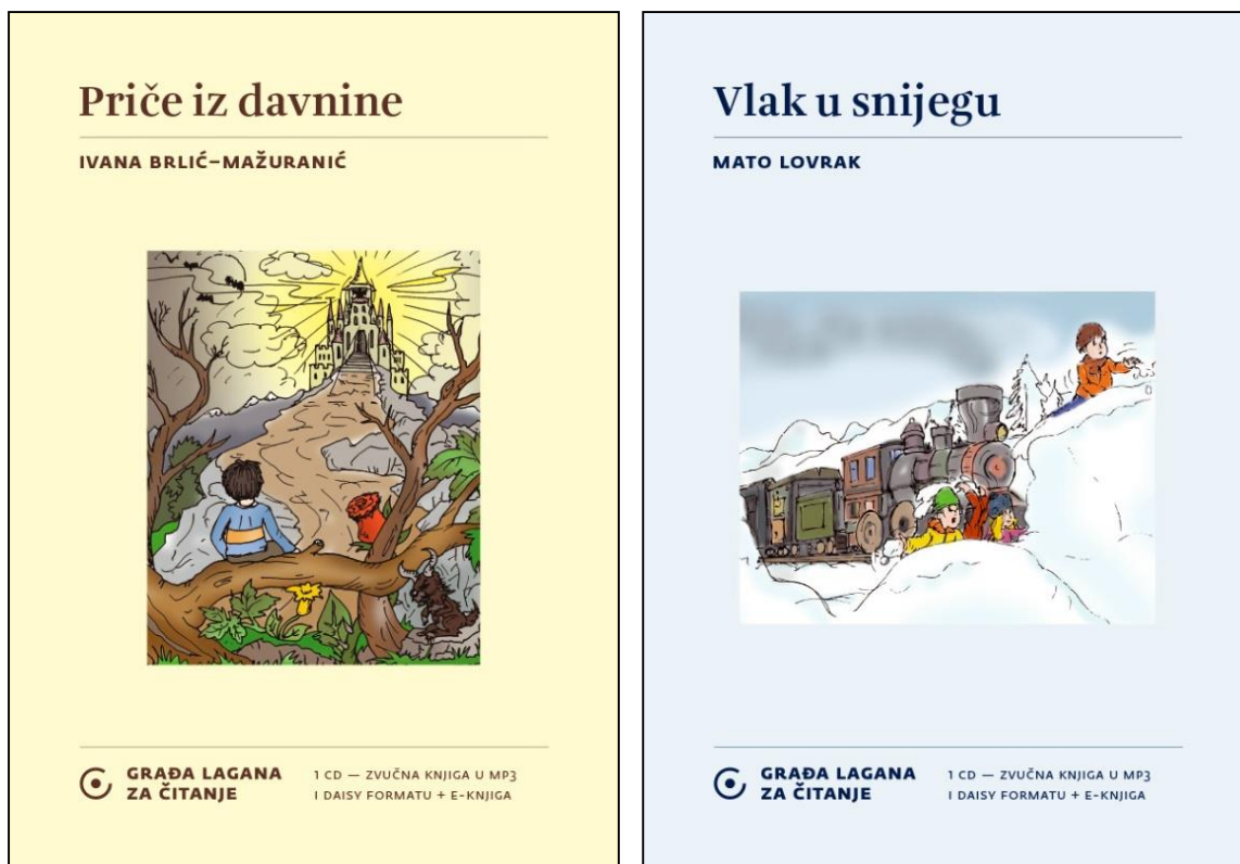
Slika 3. Naslovnice lektira Priče iz davnine i Vlak u snijegu Zaklade Čujem, Vjerujem, Vidim

Projekt Slikuljica podrazumijeva prilagodbu lektirnih naslova za učenike s teškoćama u čitanju od prvog do osmog razreda, a temeljen je na Smjernicama za građu laganu za čitanje. Učenici sedmih i osmih razreda sažimaju tekstove prema propisanim pravilima i uz vodstvo učiteljica i stručnih suradnica te svaki ulomak ilustriraju vlastitim crtežima. Dodatna posebnost ovog programa je što učenici koji kreiraju tekstova razvijaju socijalno osjetljivost u pozitivan stav prema pomaganju drugima i volonterstvu te razvijaju svoje vještine čitanja i pisanja te likovnog izražaja. Autorice projekta odvažile su se na ovaj zahtjevan posao jer u Republici Hrvatskoj nema dovoljno materijala koji je prilagođen za čitanje učenicima s teškoćama u čitanju. Njihov cilj je objaviti knjige na hrvatskom, njemačkom i engleskom jeziku u tiskanom obliku sa zvučnim zapisom i knjigu u elektronskom obliku (Stančić, 2016).