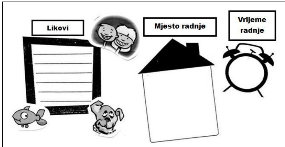
Slika 6. Grafički organizatori – likovi, mjesto i vrijeme radnje

Jedna od strategija koju učenici mogu primjenjivati za vrijeme čitanja su grafički (semantički) organizatori . To su grafičke sheme kojima možemo ilustrirati strukturu teksta i poveznice između glavnih ideja ili koncepata u tekstu (Cvitković, 2014), odnosno to su gotovi obrasci koji nam olakšavaju interpretaciju pročitaneog teksta (Stančić, 2013).