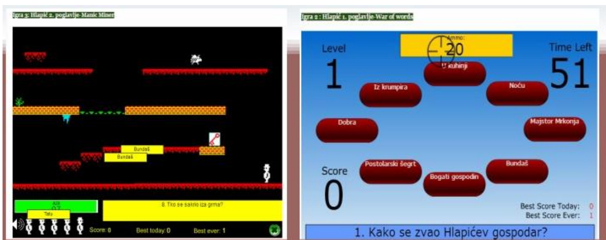
Slika 1. Classtools arkadna igra

sustavu za online učenje Loomen s ciljem ponude interaktivnijeg i zanimljivijeg pristupa u obradi lektire. Tečaj je osmišljen i predstavljen po danima Hlapićeva putovanja, a svaki dan sadržava različite alate kojima učenici mogu oblikovati svoje multimedijske sadržaje, ali i vidjeti sadržaje koje su oblikovali drugi učenici. Svoje znanje nakon čitanja lektire učenici mogu provjeriti kroz različite kvizove i igre. Npr. putem Classtools arkadne igre učenici osmišljavaju pitanja koja su polazišna točka svih kreiranih igara, a točnim odgovorima napreduju na nove razine igre, dok se web alatom Quiz your friends učenici mogu poslužiti za izradu kviza o romanu kako bi njihovi prijatelji mogli lakše provjeriti razumijevanje pročitano (De Vrgna, 2016).