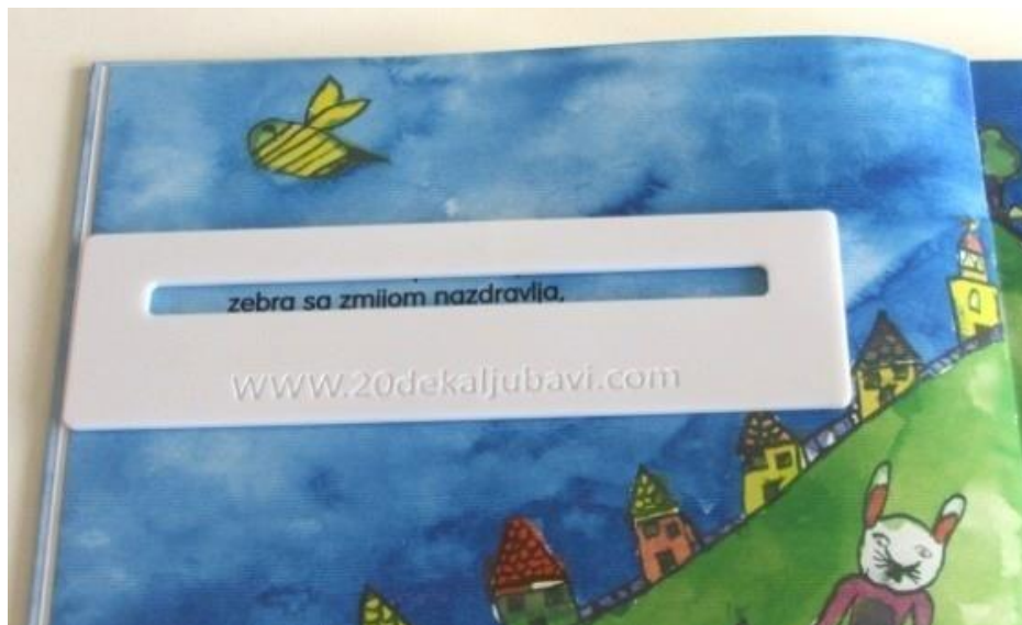
Slika 7. Čitač skitač – jedan od brojnih oblika orijentira pri čitanju

Učenike koji imaju teškoće s praćenjem reda prilikom čitanja potrebno je upućivati na korištenje različitih orijentira pri čitanju – praćenje slijeda čitanja prstom, povlačenje crta pri čitanju, uporaba podupirača i sl. (Ivančić i Stančić, 2006).