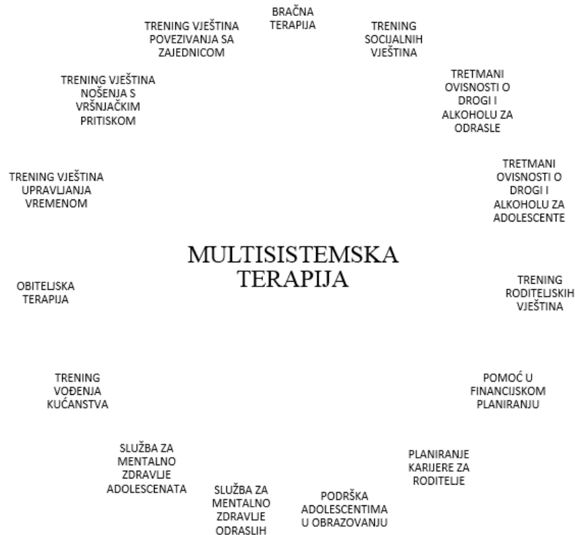
Slika 2: Sve intervencije unutar multisistemske terapije 6

Iako multisistemska terapija nije tretman koji je izravno namijenjen suzbijanju ovisnosti o drogama, ona se fokusira na širok spektar problema kod djece s poremećajima u ponašanju, pa tako i ovaj. Nekoliko studija je potvrdilo njenu učinkovitost i u tom području. Henggeler, Pickrel i Brondino (1999) proveli su istraživanje na 118 maloljetnika uključenih u tretman kojima je dijagnosticiran neki oblik poremećaja vezan za ovisnost o psihoaktivnim tvarima, te njihovim obiteljima. Cilj istraživanja bio je saznati učinke tretmana neposredno nakon završetka, te jesu li se održali 6 mjeseci kasnije. Multisistemska terapija je smanjila samoiskazano uzimanje alkohola, marihuane i ostalih droga, no te promjene se nisu zadržale. Iznimka su bile jedino skupine sudionica ženskog spola te mlađe djece. Kod njih su se ishodi zadržali dugoročnije. Follow-up studija koja je provjeravala ishode multisistemske terapije četiri godine nakon njenog završetka