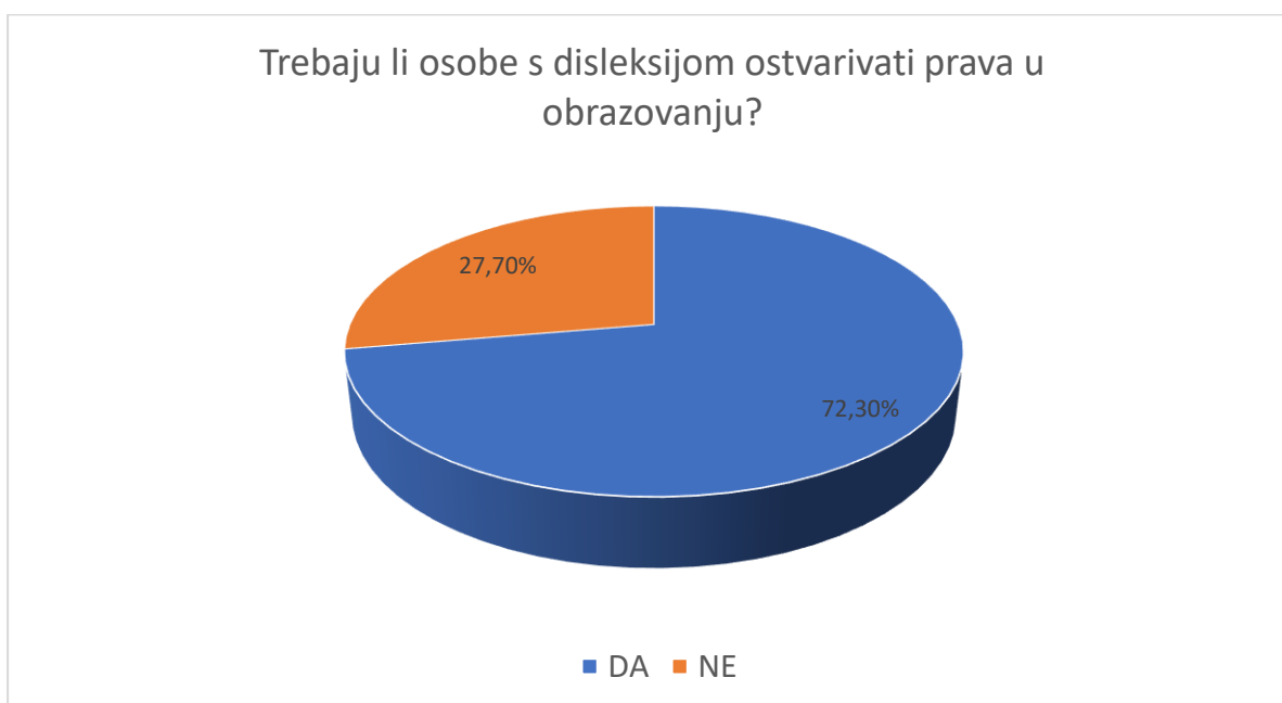
Grafički prikaz 2: Učestalost ispitanika na varijabli obrazovne potrebe

Na sljedećem grafičkom prikazu 2 vidljivi su podaci vezani uz znanje ispitanika o obrazovnim potrebama osoba s disleksijom.