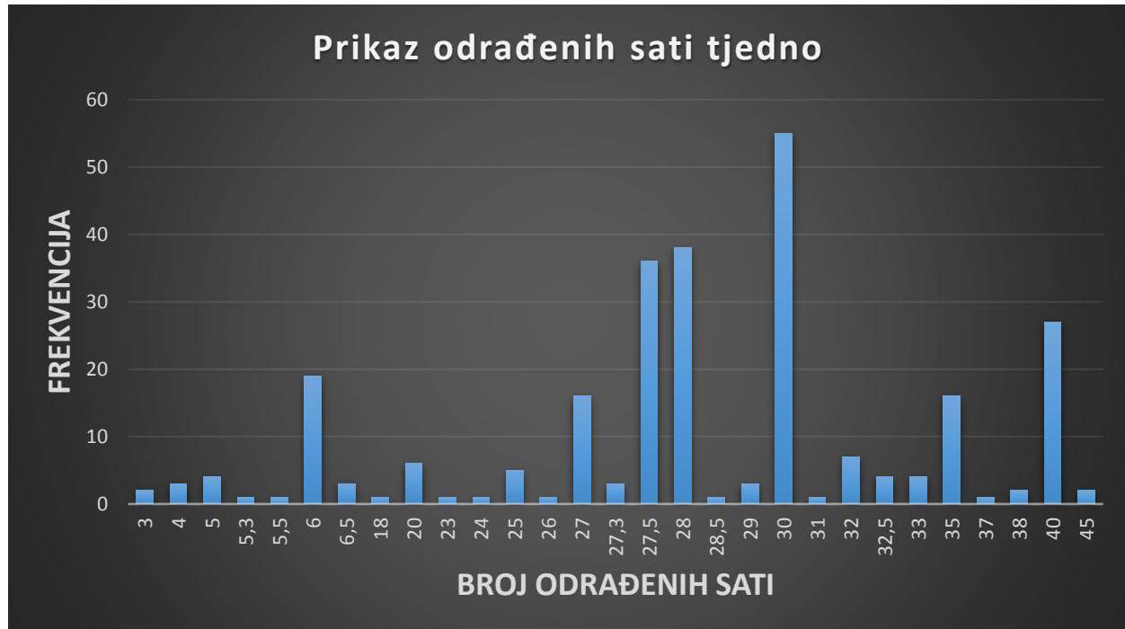
Slika 2. Prikaz broja odrađenih sati tjedno

S namjerom da se prikupe podaci o vrtičkim skupinama s kojima ispitanice rade, u istraživanju su bile ponuđene dvije opcije: 1) jaslička skupina (1-3 godine) i 2) mješovita vrtička skupina (3-7 godina). Dobiveni su rezultati da 31,1% odgojiteljica radi s jasličkom skupinom djece, dok je taj postotak puno veći za mješovitu vrtičku skupinu i on iznosi 68,9%.