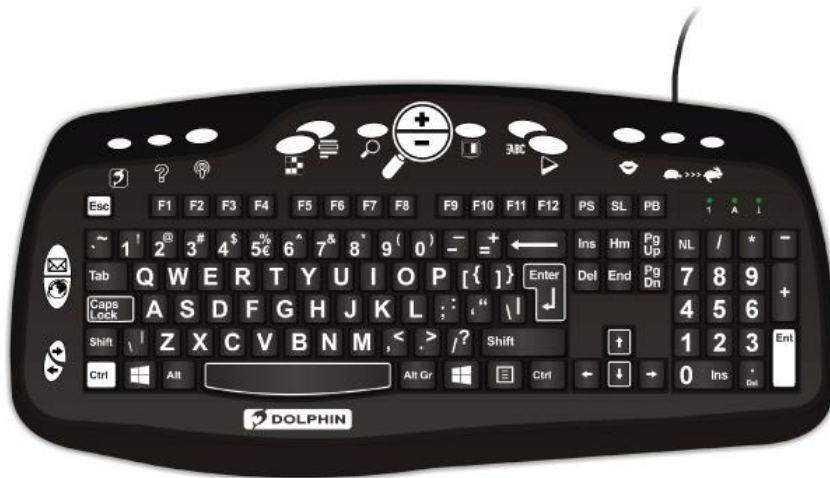
Slika 16. Dolphin Large Print tipkovnica

Korištenje prepoznavanja glasa ili govora za upravljanje računalom i kombiniranjem ovog teksta s tekstom u govor uklanjaju potrebu za fizičkim tipkanjem ili gledanjem zaslona. Kao i svaka nova vještina, kontrola glasa može zahtijevati malo strpljenja za učenje, ali može biti posebno učinkovita za osobe sa oštećenjem vida (Leibs, 2020). Većina operativnih sustava računala, tableta i pametnih telefona ugrađeni su prepoznavanje glasa, što korisniku omogućuje davanje naredbi kao što su otvaranje programa ili aplikacija i diktiranje teksta, a mogućnosti se neprestano razvijaju i poboljšavaju.