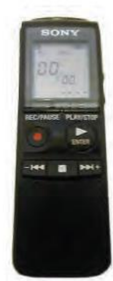
Slika 10. Digitalni snimači ili diktafoni za osobe oštećena vida

Jedan od takvih je Sony PX720 uređaj za snimanje i reproduciranje zvuka raspolaže memorijom od 64 Mb što je dovoljno za 7 sati neprekidnog snimanja odličnog kvaliteta. Može se povezati sa računarom USB priključka. Softver za prebacivanje snimaka i podešavanje postavki diktafona je kompatibilan s čitačima ekrana kao što je primjerice JAW for Windows koji je već navođen (Lazor, 2017).