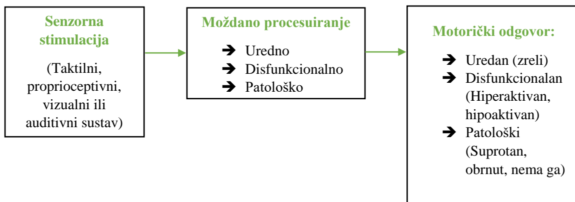
Slika 2 Prikaz procesa trodijelnog refleksnog sklopa (Masgutova i sur., 2016)

Prirodna aktivacija refleksnog motoričkog odgovora započinje s nakupljanjem napetosti u uključenim mišićima, a završava s otpuštanjem te napetosti u pokretu. Kada refleksni sustav funkcionira na ispravan način, živčani sustav prepoznaje podražaj iz okoline te aktivira zaštitne motoričke odgovore koji su u skladu sa samim podražajem (Rentschler, 2008). Takva reakcija kod čovjeka upućuje na zrelost živčanog sustava (Shackelford, 2015).