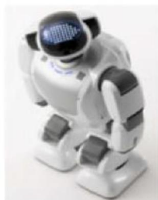
Slika 8. Robot Parlo (Rückert i sur., 2012)

Shamsuddin i sur. (2013) proveli su istraživanje na 6 djece sa PSA – om (od toga 5 dječaka i 1 djevojčica, prosječna dob 8.7, svi s nižim IQ) u interakciji s robotom i u razredu. Korišten je NAO humanoidni robot (Slika 9) koji posjeduje 25 stupnjeva slobode zahvaljujući kojima ima mogućnost izražavanja neverbalnih ponašanja i mogućnost percipiranja informacija iz okoline zahvaljujući senzorima, mikrofonom i kamerama. Također, ima mogućnost govora i izražavanja neverbalnih ponašanja te su za korištenje dostupne aplikacije poput ASK NAO (Autism Solution for Kids) koja je zapravo paket specijaliziranih aplikacija koje se temelje na metodama koje se koriste u specijalnoj edukaciji. Pokazalo se kako su djeca u interakciji s njim izražavala manje stereotipnih ponašanja. Smanjenje takvih ponašanja vidljivo je i u istraživanju Tapus i sur. (2012).