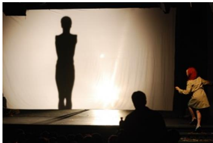
Slika 2: „Ljepotica i zvijer“

Primjer jedne drame je „Hello/Goodby Ada Who?“ autorice HolLynn D'lil. Kao i druge umjetnosti inspirirane temom invaliditeta ova drama naglašava diskriminacijska i uvredljiva ponašanja dominantnog ne-invalidnog društva postavljajući takva ponašanja kao značajnu barijeru u interakciji s pojedincem s invaliditetom (Abbas i sur., 2004). Mat Fraser i Julie Atlas Muz, oboje poznati umjetnici u svojim područjima, započeli su zajednički rad u vidu stvaranja predstave „Ljepotica i zvijer“. Bajka „Ljepotica i zvijer“ odabrana je zbog svojih arhetipskih likova s kojima se Fraser i Muz love u koštac, dekonstruirajući ih te kroz njih nužno reinterpretirati tradicionalne definicije ljepote i zvjerskog, odanosti, boli razdvajanja, smrti ljubavi i transformacije kroz ljubav (Bago i sur., 2007).