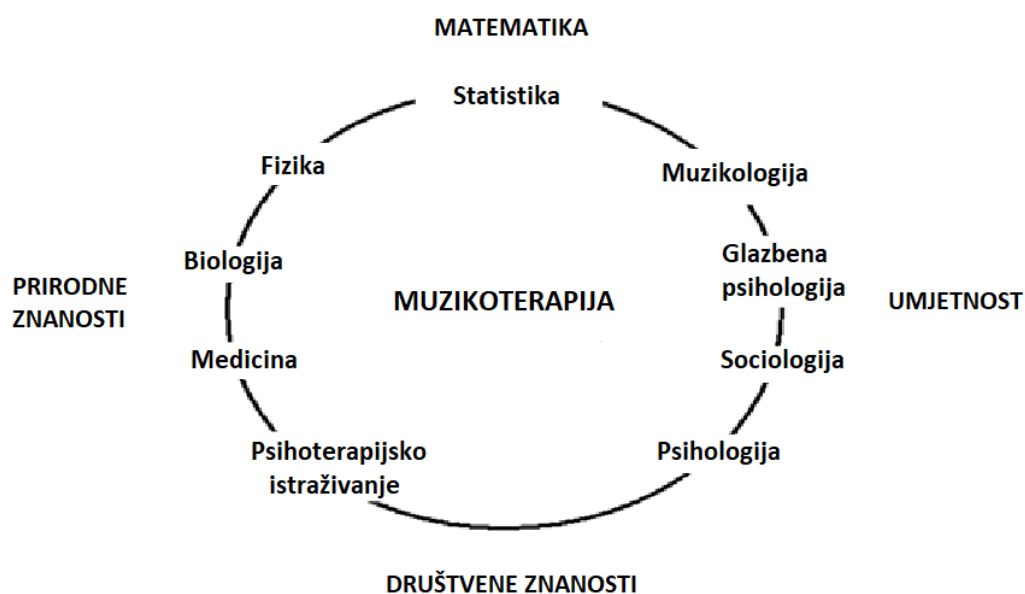
Slika 1. Muzikoterapija – multidisciplinarno područje (Hillecke i sur., 2005)

Svjetska udruga za terapiju glazbom definirala je 2011. godine muzikoterapiju kao: „profesionalno korištenje glazbe i njezinih elemenata u svrhu intervencije u medicinskom, edukacijskom i svakodnevnom okruženju s pojedincima, grupama, obiteljima ili zajednicama koje pokušavaju optimizirati njihovu kvalitetu života i poboljšati njihovo fizičko, socijalno, komunikacijsko, emocionalno, intelektualno i duhovno zdravlje i dobrobit. Istraživanje, praktičan rad, edukacije i kliničko osposobljavanje za terapiju glazbom bazirani su na profesionalnim standardima uzimajući u obzir kulturološko, socijalno i političko okruženje“ (Divljaković i sur, 2014). Bruscia (1998, prema Wheeler, 2015) govori da je muzikoterapija intervencija u kojoj terapeut pomaže klijentu da unaprijedi zdravlje koristeći glazbena sredstva i veze koje se pomoću njih stvaraju. Terapeuti koriste glazbena obilježja i odnos s klijentom kako bi pristupili emocijama i sjećanjima te strukturirali ponašanje u svrhu postizanja ciljeva terapije. On također navodi da je za muzikoterapiju bitno znati kakve su glazbene sklonosti klijenta, kakvi su njegovi fizički preduvjeti i psihološka iskustva vezana uz percepciju glazbe. Postoje i mnoge druge definicije muzikoterapije, a razlikuju se prema onome što osoba koja daje definiciju stavlja u prvi plan kao cilj terapije i područje djelovanja.