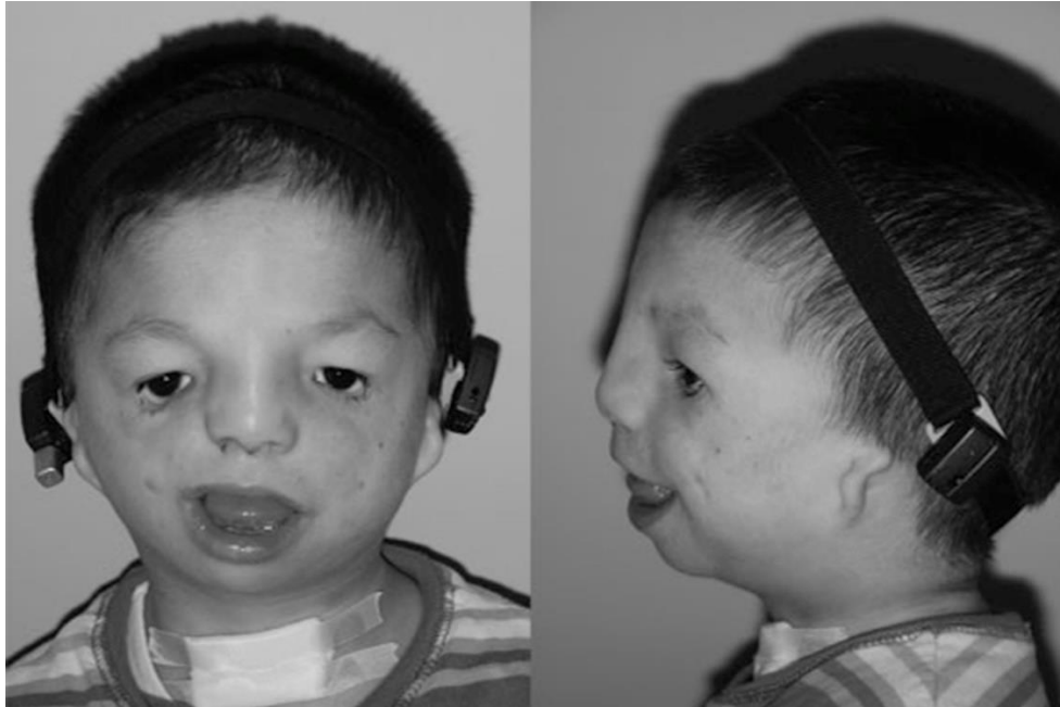
Slika 6. Treacher Collins sindrom. Preuzeto s: https://www.plasticsurgery.theclinics.com/article/S0094-1298(18)30102-0/fulltext (25.5.2022.)

U pregledanoj literaturi ne spominju se abnormalnosti u funkciji ostalih organskih sustava kao niti odstupanja u psihosocijalnom i motoričkom razvoju.