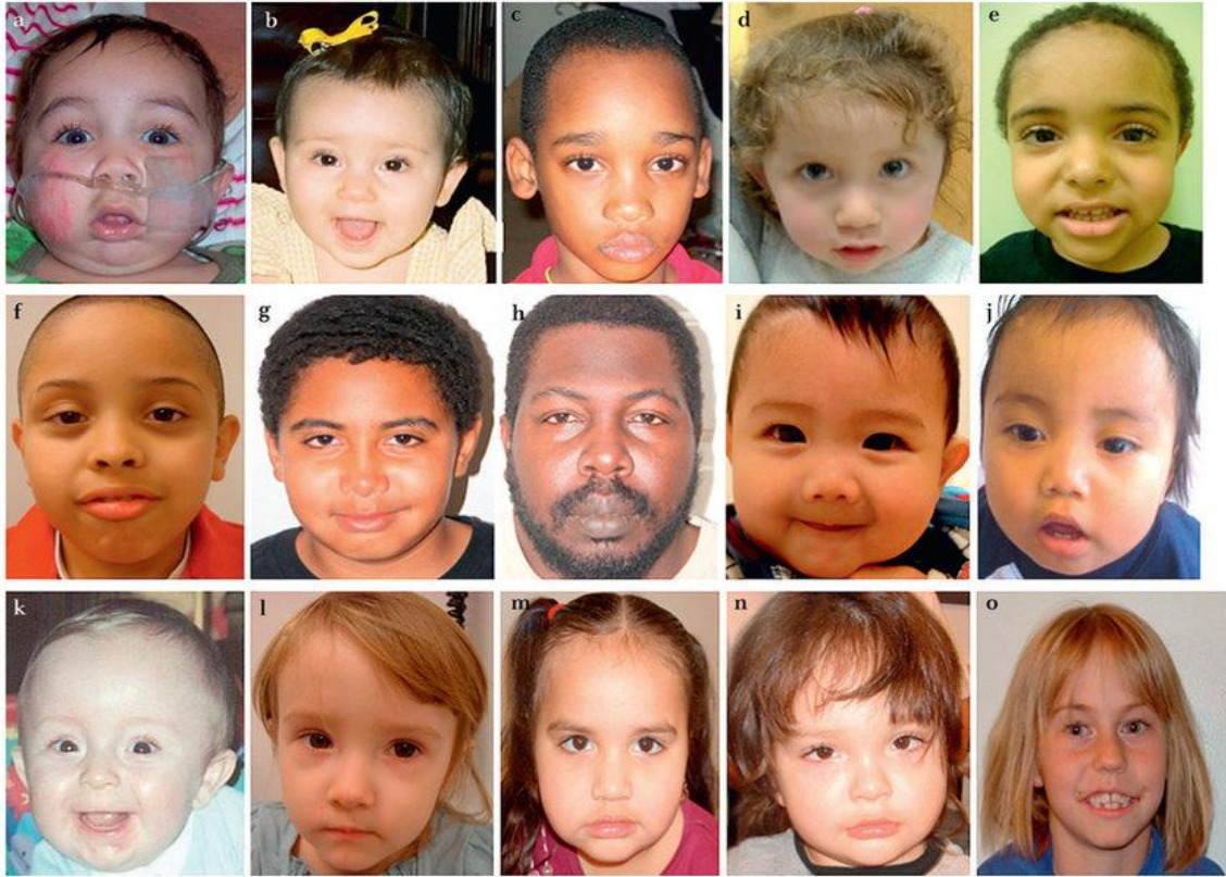
Slika 2. Fenotipska varijabilnost 22q11.2DS. Preuzeto s: https://www.researchgate.net/figure/Facial-features-of-individuals-with-16p112-deletion-a-case-1-b-case-2-c-case-3-d_fig4_38090869 (25.5.2022.)