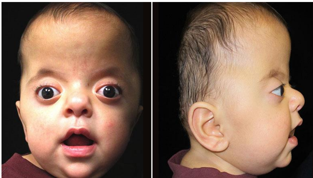
Slika 5. Apertov sindrom. Preuzeto s: https://www.chop.edu/conditions-diseases/apert-syndrome (25.5.2022.)