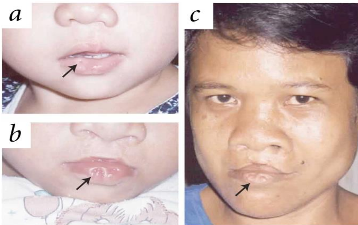
Slika 8. Usne fistule kod Van der Woude sindroma. Preuzeto s: https://www.nature.com/scitable/content/van-der-woude-syndrome-6959/ (25.5.2022.)