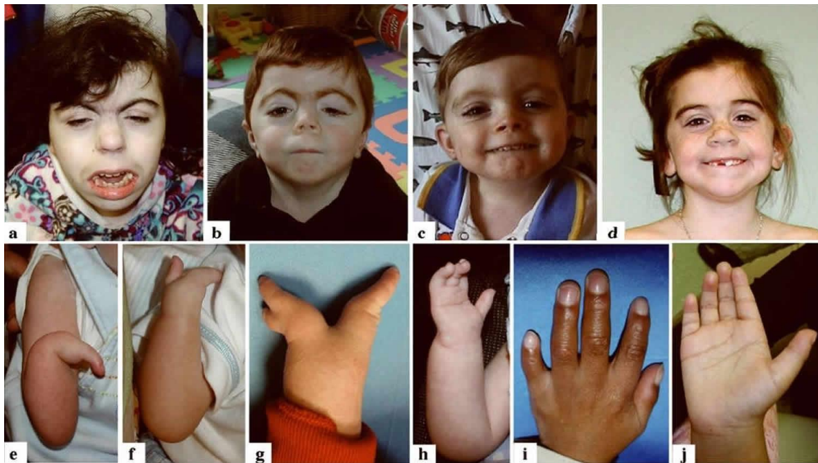
Slika 4. Kornelia de Lange sindrom. Preuzeto s: https://healthjade.net/cornelia-de-lange-syndrome/ (25.5.2022.)