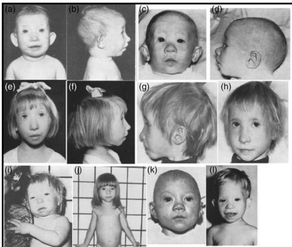
Slika 7. Dubowitz sindrom.