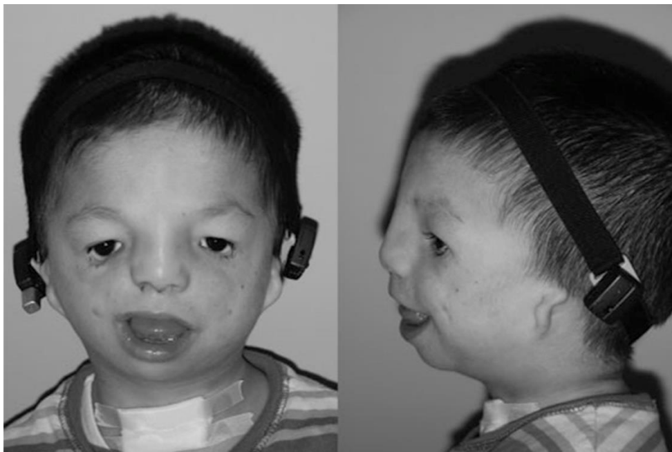
Slika 6. Treacher Collins sindrom.

U pregledanoj literaturi ne spominju se abnormalnosti u funkciji ostalih organskih sustava kao niti odstupanja u psihosocijalnom i motoričkom razvoju.