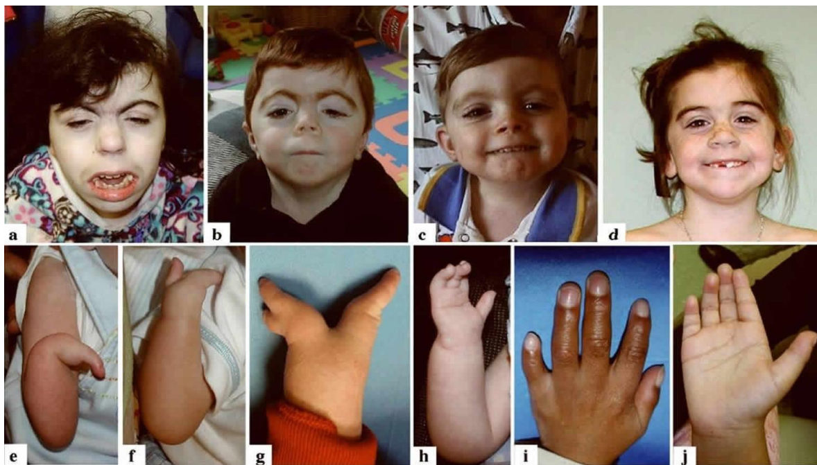
Slika 4. Cornelia de Lange sindrom.