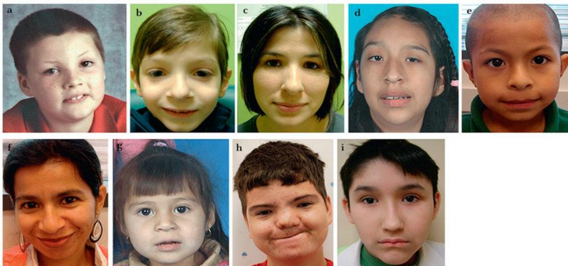
Slika 3. Fenotipska varijabilnost 22q11.2DS.