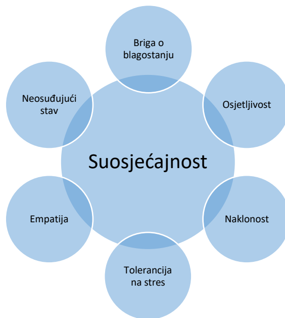
Slika 1: Atributi suosjećajnosti (Gilbert, 2009b)

Gilbert (2009b) suosjećajnost definira kroz niz atributa koji su potrebni da bi osoba mogla uopće razviti suosjećajnost. Atributi suosjećajnosti uključuju: a) brigu o blagostanju b) osjetljivost, koja predstavlja osjetljivost na potrebe drugog i mogućnost distinkcije osjećaja i potreba onoga za koga brinemo, c) naklonost, koja predstavlja osjećaj dirnutosti tuđim iskustvom ili osjećajima, d) toleranciju na stres, sposobnost osjećanja i podnošenja intenzivnih emotivnih stanja, e) empatiju, odnosno sposobnost razumijevanja značenja tuđeg unutarnjeg svijeta te mogućnost zauzimanja tuđe perspektive te f) ne osuđujući stav. Atributi suosjećajnosti grafički su prikazani na Slici 1.