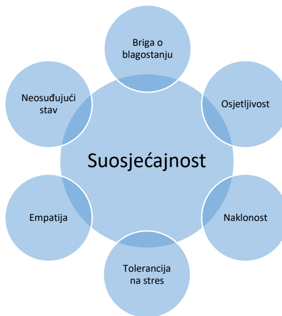
Slika 1: Atributi suosjećajnosti (Gilbert, 2009b)

Gilbert (2009b) suosjećajnost definira kroz niz atributa koji su potrebni da bi osoba mogla uopće razviti suosjećajnost. Atributi suosjećajnosti uključuju: a) brigu o blagostanju b) osjetljivost, koja predstavlja osjetljivost na potrebe drugog i mogućnost distinkcije osjećaja i potreba onoga za koga brinemo, c) naklonost, koja predstavlja osjećaj dirnutosti tuđim iskustvom ili osjećajima, d) toleranciju na stres, sposobnost osjećanja i podnošenja intenzivnih emotivnih stanja, e) empatiju, odnosno sposobnost razumijevanja značenja tuđeg unutarnjeg svijeta te mogućnost zauzimanja tuđe perspektive te f) ne osuđujući stav. Atributi suosjećajnosti grafički su prikazani na Slici 1.