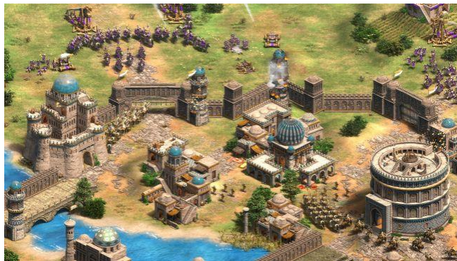
Slika 7. Igra Age of Empire 2, preuzeto 11.3.2022. s: