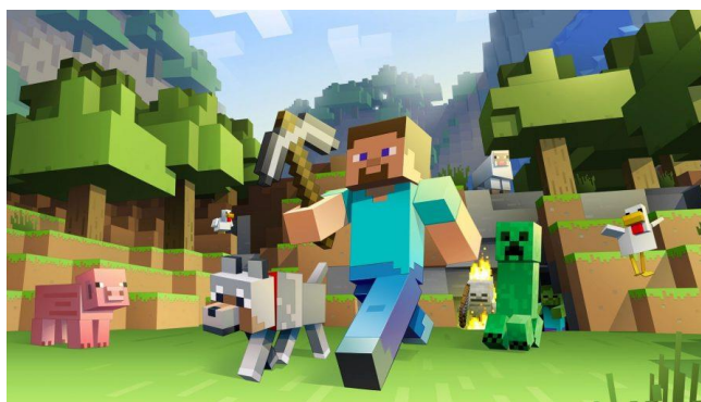
Slika 5. Igra Minecraft, preuzeto 23.3.2022. s:

U igrama preživljavanja igrač se nalazi u neprijateljskom okruženju s vrlo malom količinom opreme i zaliha. Postavljenih ciljeva igre nema, već je zadaća igrača preživjeti što duže. To zahtijeva izradu skloništa, alata i oružja te sakupljanje raznih resursa (Plarium, 2022). Osoba u ovim igrama mora razmišljati dugoročno, primjerice računati koliko zaliha hrane ima, gdje je najbolje postaviti zaklon, što joj sve treba kako bi preživjela i slično (Plarium, 2022). Igre preživljavanja mogu se igrati izvan mreže, ali i online u multiplayer načinu što omogućuje interakciju i suradnju između igrača u zajedničkom virtualnom prostoru (Plarium, 2022). Neke od najpoznatijih igri preživljavanja danas su Minecraft, Rust, This War of Mine, DayZ i Subnautica (PCGamesN, 2022a).