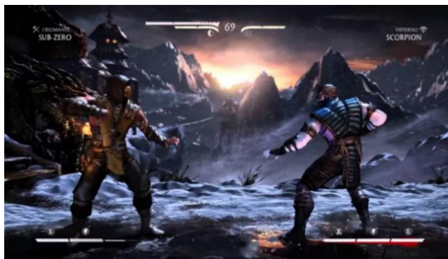
Slika 4. Igra Mortal Kombat, preuzeto 11.3.2022.s:

sportova, one mogu uključivati i borbu oružjem poput mača. Igrač često mora kombinirati posebne poteze koje izvodi brzim pokretima miša i/ili pritiskanjem tipki na tipkovnici ili konzoli. Neke od najpoznatijih borilačkih videoigara su „Mortal Kombat“ i „Street Fighter“ (Technopedia, 2011a).