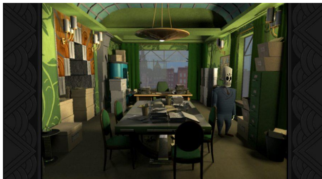
Slika 8. Igra Grim Fandango, preuzeto 23.3.2022. s:

https://www.pcgamesn.com/best-adventure-games