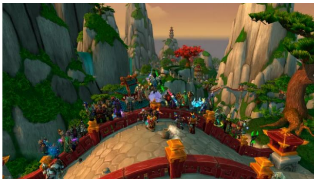
Slika 11. Igra World of Warcraft, preuzeto 12.3.2022. s: