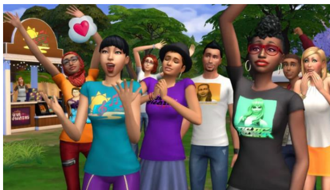
Slika 9. Igra The Sims 4, preuzeto 12.3.2022.s :