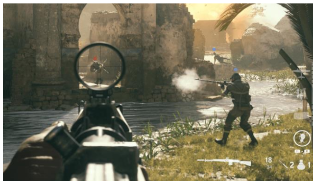
Slika 1. Igra Call of Duty, preuzeto 10.3.2022. s: