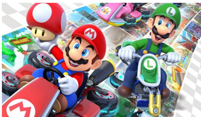
Slika 3. Igra Mario Kart 8 Deluxe, preuzeto 11.3.2022. s: