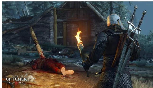
Slika 6. Igra The Witcher 3, preuzeto 11.3.2022. s: