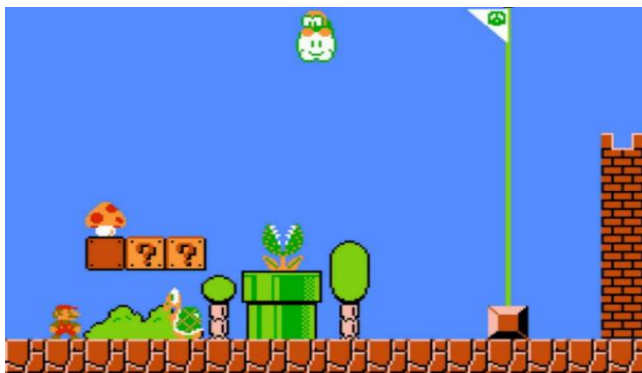
Slika 2. Igra Super Mario Bros, preuzeto 11.3.2022. s

:https://www.theverge.com/2015/9/14/9324833/super-mario-brothers-30th-anniversary-date