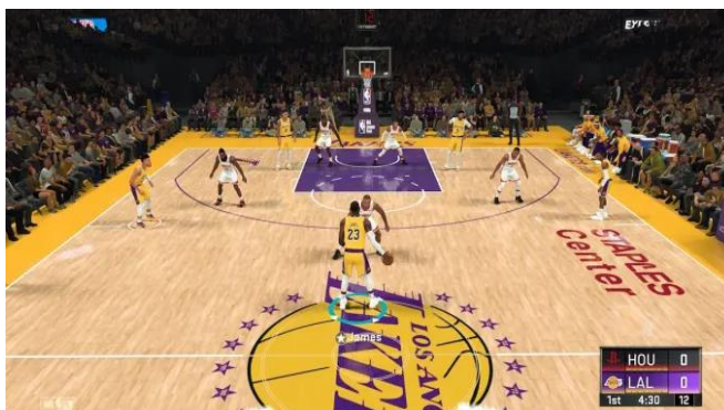
Slika 10. Igra NBA

Sportske videoigre su kompetitivne igre u kojima se simulira igranje nekog sporta poput nogometa, košarke, atletike ili ekstremnog sporta (Codex Gamicus, 2011b). One obuhvaćaju sve vrste sportskih igara. Neke od podvrsta su ekstremne sportske videoigre, zatim arkadne i simulacijske sportske videoigre te statističke sportske videoigre (Codex Gamicus, 2011b). One se igraju na vrlo različite načine, a jedino zajedničko svima je to što prikazuju neki sport. U nekim videoigrama cilj je samo igranje sporta, dok se u drugim igrama igrač mora koncentrirati na organizaciju i razmišljati strateški (Codex Gamicus, 2011b). Neke od najpoznatijih sportskih videoigara su „NBA“, „Pro Evolution Soccer“ i „FIFA“ (GLHF, 2021).