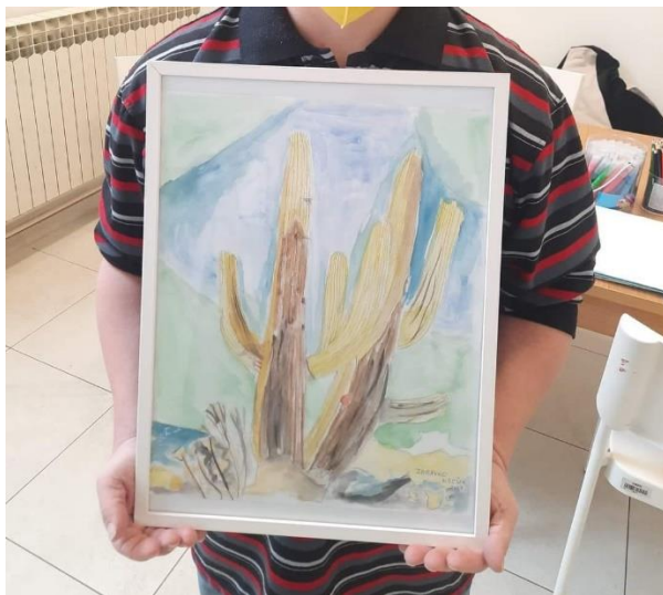
Slika 2. Z.K. „Kaktusi“

Exchange Project ) koja je održana u Koreji. Također, sudjelovao je i na izložbi likovnih radova „Crtež kao medij“ u Muzeju suvremene umjetnosti te na izložbi „Drugačiji i jednaki – umjetnost i inkluzija“ također u suradnji s Muzejom suvremene umjetnosti. Njegovo najveće postignuće do sada, je prolazak na natjecanju za nacionalnu izložbu akvarela, Deveti hrvatski trijenale, s radom „Kaktusi“ te je njegov rad izložen na izložbama u Karlovcu, Slavonskom Brodu te Zagrebu. Također, o Z. i njegovom životu i talentu je napravljen prilog u emisiji „Mir i dobro“ te u IN magazinu.