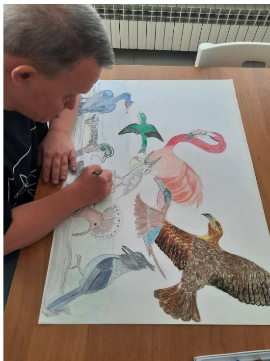
Slika 3. Z.K. „Ptice“