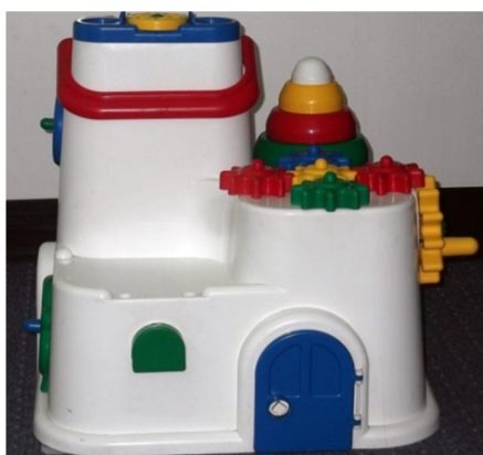
Slika 2. Kućica

Pri provođenju zadatka Preferencija robot-predmet na podu ispitne prostorije, ispred jednosmjernog stakla, se nalazio humanoidni robot. U istoj ravnini, na korak udaljenosti od robota, stajala je plastična igračka- kućica (slika 2). Ona je zbog svoje bijele boje sa šarenim detaljima poput vrata, kolutova i zupčanika, koji proizvode zvuk pri okretanju, vizualno, taktilno i auditivno primamljiva. Iako se prema širini razlikuju, visine kućice i robota, kada je u sjedećem položaju, su približno jednake (slika 3).