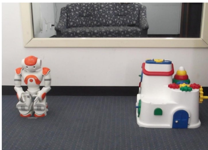
Slika 3. Postava za izvedbu zadatka Preferencija robot-predmet

Zadatak Preferencija robot-predmet se provodio na način da su pratitelj i dijete zajedno ušli u ispitnu prostoriju, pratitelj bi sjeo na dvosjed te bi se potom zatvorila vrata. Istraživači nisu bili prisutni u prostoriji. U trenutku ulaska pratitelja i djeteta u prostoriju, započelo bi audio i