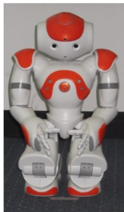
Slika 1. Robot NAO

Po potrebi su naizmjenice korištena dva NAO H25 Atom humanoidna robota, proizvođača Aldebaran Robotics (slika 1). NAO je visok 58 cm, teži oko 4,5 kilograma i ima 25 stupnjeva slobode (DOF). Zbog malih dimenzija, boje, obliha rubova i nerobusnog izgleda, djeci je izrazito dopadljiv (Petrić i sur., 2014; Shammsudin i sur., 2012). Opremljen je dvjema visokorezolucijskim kamerama, kao i s četiri mikrofona, dva zvučnika i nekoliko drugih senzora. U ovom istraživanju su mikrofoni poslužili za snimanje glasanja i govora sudionika, kamera kao dodatni izvor informacija i pomoć pri kodiranju ponašanja sudionika, a zvučnici u izvedbi zadataka Preferencija robot-osoba i Reakcije na ljudsko ponašanje robota . Osim toga, senzor na glavi robota je zasvijetlio plavom bojom svaki put kada bi ga se dotaknulo, što je poslužilo tek kao dodatna vizualna stimulacija. Ovisno o složenosti i intenzitetu zadataka koje izvodi, NAO može kontinuirano raditi od 60 do 90 minuta bez napajanja (Petrić i sur., 2014).