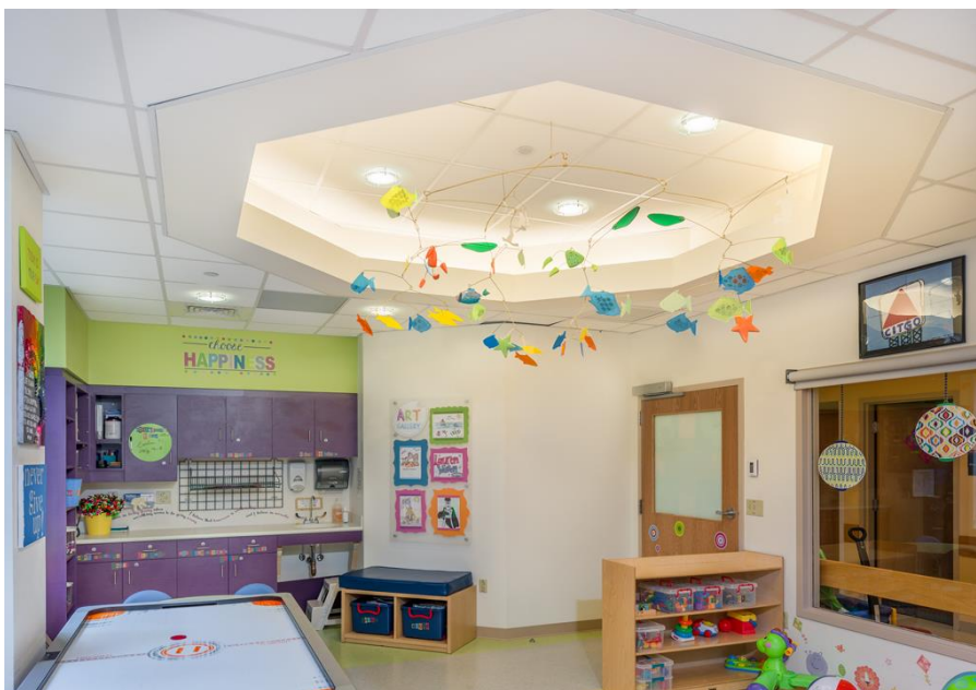
Slika 10. Primjer igraonice u bolnici

https://www.patientprovidercommunication.org/covid-19-tools/free-english-tools/ )