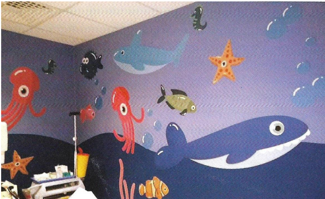
Slika 6. Primjer humanizacije bolničkih odjela (Filipušić i sur., 2020, str. 23)