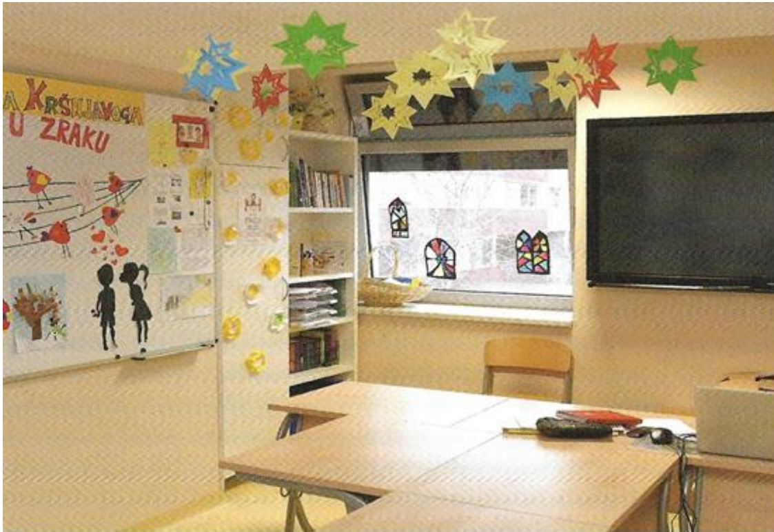
Slika 7. Primjer škole u bolnici (Filipušić i sur., 2020, str. 19)