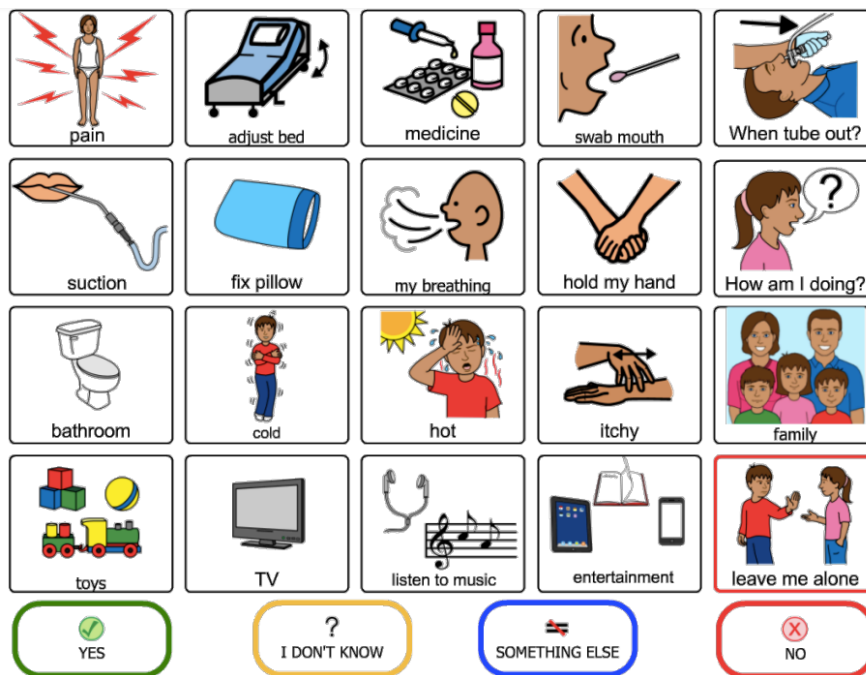
Slika 9. Primjer komunikacijske ploče za hospitaliziranu djecu

(Patient-Provider Communication. FREE English Tools . Preuzeto 20.6.2023. s: