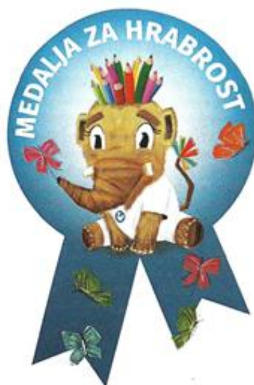
Slika 2. Primjer medalje za hrabrost (Filipušić i sur., 2020, str. 87)