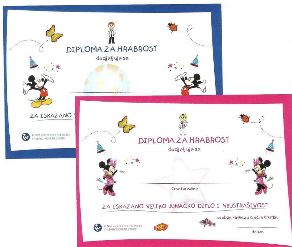
Slika 1. Primjer diplome za hrabrost (Filipušić i sur., 2020, str. 88)

Slike su stavljene uz dopuštenje autora.