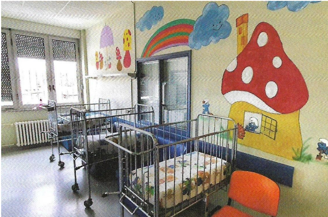
Slika 5. Primjer dječje sobe u bolnici (Filipušić i sur., 2020, str. 15)