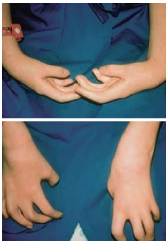
Slika 1 Nekorigirana fleksija zgloba i deformacija palca u dlanu kod devetogodišnjaka (preuzeto iz knjige „Arthrogryposis“, Bach i Almquist, 2008, str. 46)

„Kukovi mogu biti dislocirani i obično su blago flektirani. Koljena su ispružena; stopala su često u ekvinovarus položaju. Mišići nogu su obično hipoplastični a ekstremiteti su cjevasti i bezoblični. Na ventralnim stranama flektiranih zglobova ponekad dolazi do stvaranja pterigija“ (MSD, 2014).