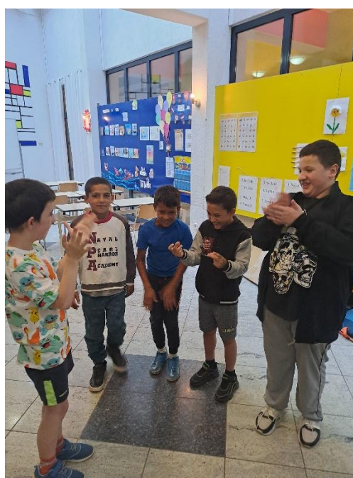
Slika 13: Dramska tehnika „Kiša“