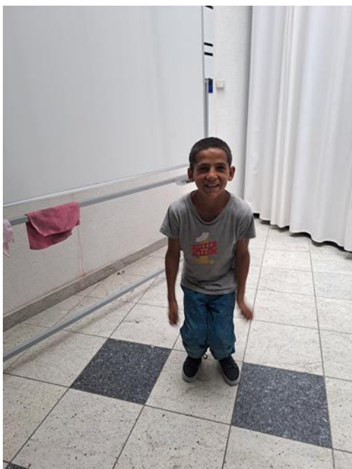
Slika 14: Dramska tehnika „Igra pantomime“