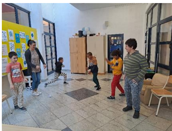
Slika 8: Dramska tehnika „Grudanje“