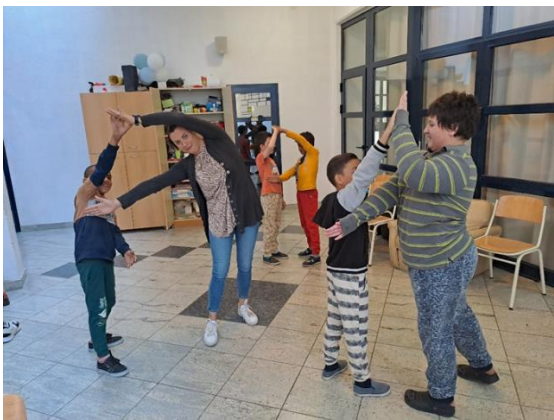
Slika 1: Dramska tehnika „Kipovi“

Uočene promjene: Kroz igru oblikovanja slova tijelom, učenici pokazuju povećanu razinu kreativnosti i motiviranosti. Isto tako, poticali su maštovitost jer su razmišljali na koji način mogu iskoristiti svoje tijelo. Često su se u paru dogovarali na koji način će oblikovati slova svojim tijelom pa su se time razvijali timski rad, komunikacija i socijalni odnosi. Jedan učenik je znao preuzeti ulogu voditelja, a neki je bio pasivniji u ulozi sljedbenika. Radeći i surađujući u paru, učenici produbljuju svoje prijateljske odnose. Učenici su bili motivirani i zainteresirani kako bi pokazali svoje znanje i svoje vještine. Oblikovanje slova pred cijelim razredom pomaže učenicima da razviju samopouzdanje.