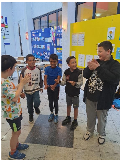
Slika 12: Dramska tehnika „Kiša“