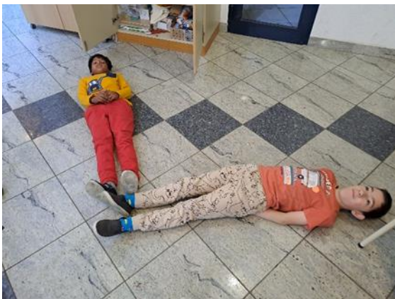
Slika 3: Dramska tehnika „Kipovi“