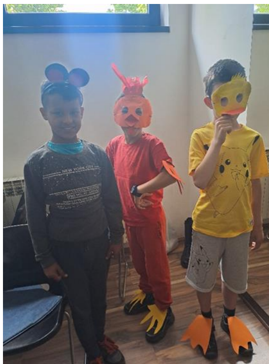
Slika 9 i Slika 10: Dramska tehnika „Mala crvena koka i zrno pšenice“