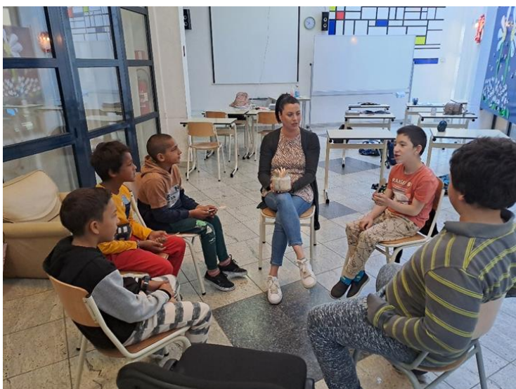
Slika 5: Dramska tehnika „Bomba“