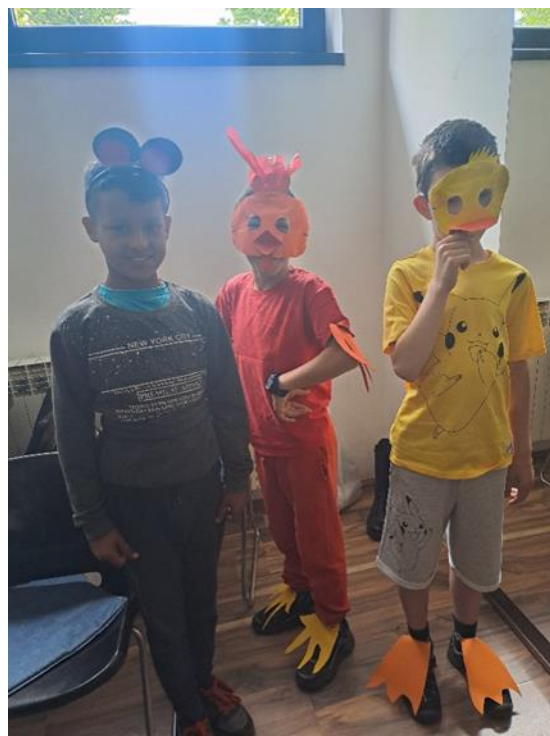
Slika 9 i Slika 10: Dramska tehnika „Mala crvena koka i zrno pšenice“