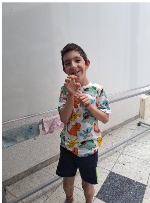
Slika 17: Dramska tehnika „Igra pantomime“