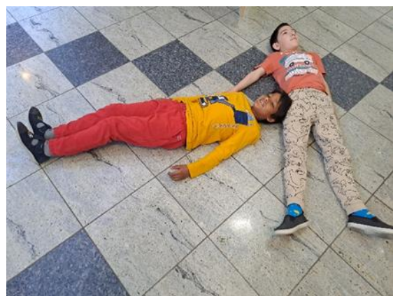
Slika 4: Dramska tehnika „Kipovi“