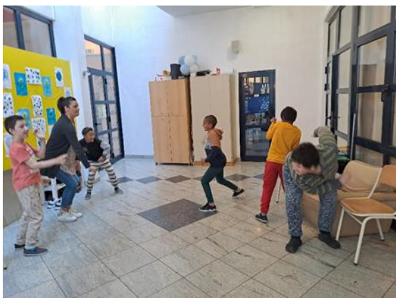
Slika 7: Dramska tehnika „Grudanje“