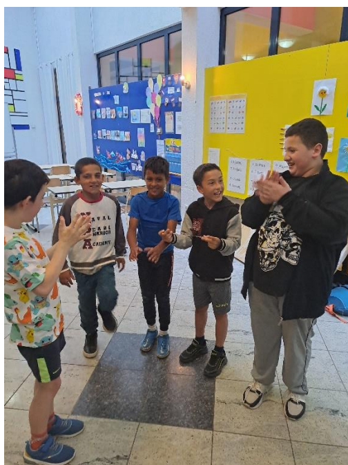
Slika 12: Dramska tehnika „Kiša“