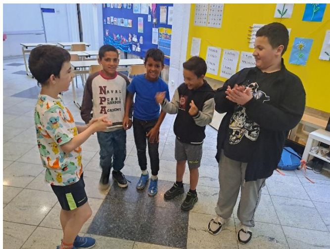
Slika 11: Dramska tehnika: „Kiša“

s kišom, što potiče verbalnu komunikaciju. Izražavanjem kroz zvuk i fizičke pokrete pred ostalima, razvijaju se kreativnost i samopouzdanje.