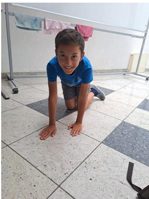
Slika 16: Dramska tehnika „Igra pantomime“