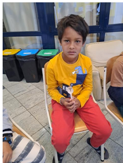
Slika 6: Dramska tehnika „Bomba“