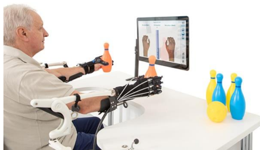
Slika 5. Robotski uređaj GloReha Sinfonia