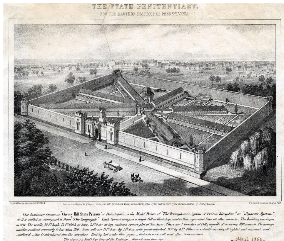
The State Penitentiary for the Eastern District of Pennsylvania