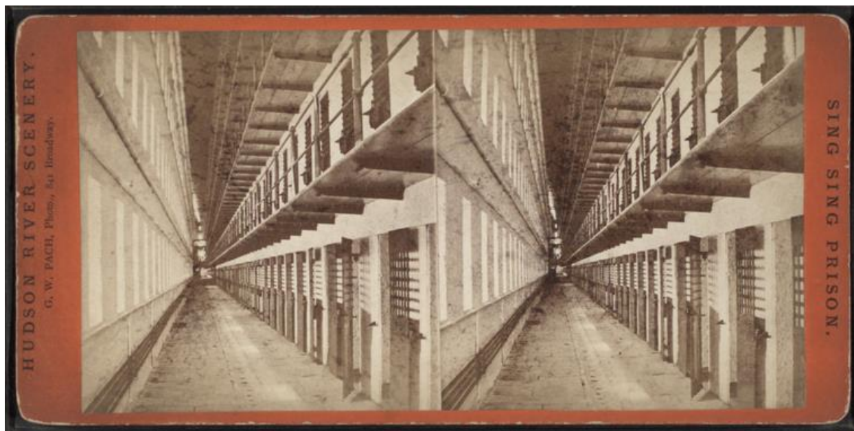
Sing Sing prison