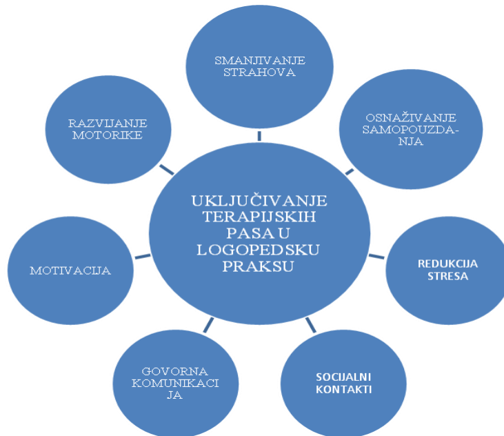
Prikaz 2. Uključivanje terapijskih pasa u logopedsku praksu (prema Bohnen, 2015).

Bohnen (2015) klasificira ciljeve uključivanja terapijskih pasa u logopedsku praksu: