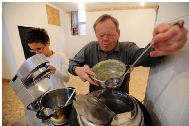
Slika 1: Priprema sapunske baze