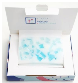
Slika 7: Mozaik sapun četvrtasti - plavi