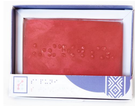
Slika 5: Sapun s točkicama – Dubrovnik