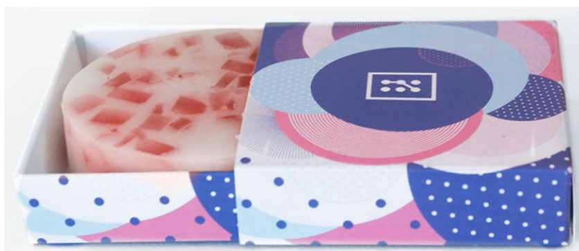
Slika 9: Mozaik sapun okrugli – crveni