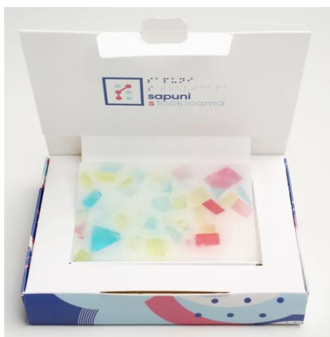
Slika 8: Mozaik sapun četvrtasti – šareni