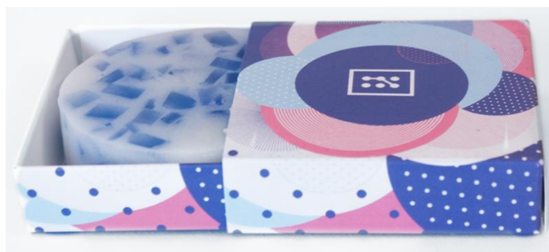
Slika 10: Mozaik sapun okrugli – plavi