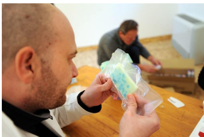
Slika 3: Pakiranje gotovih sapuna u ambalažu