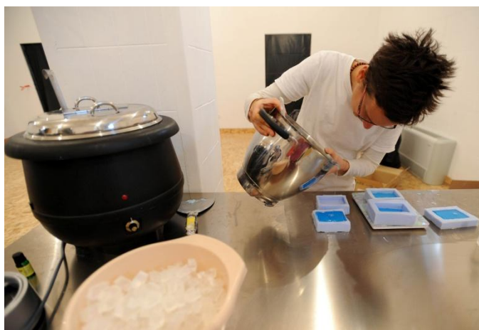
Slika 2: Prelijevanje sapunske smjese u kalupe