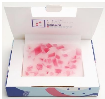
Slika 6: Mozaik sapun četvrtasti - crveni