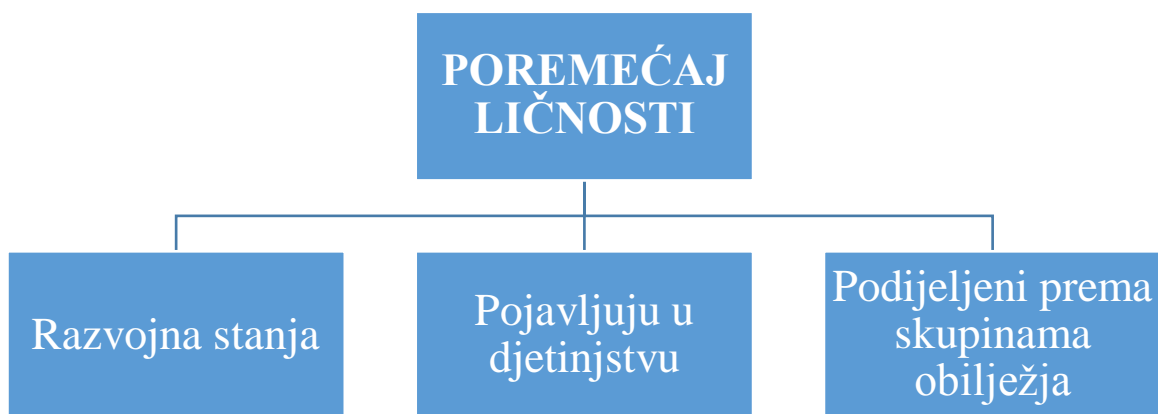
Slika 1 – Shematski prikaz najznačajnijih osnovnih obilježja poremećaja ličnosti

Svaka od etioloških skupina teorija opisuje jedan dio uzročnosti navedenih poremećaja ličnosti, fokusirajući se ili na razvoj i genetiku, na kemiju mozga ili na okolinske čimbenike koji izazivaju traumatska iskustva. Stoga je važno napomenuti da autorica ovog teksta smatra da je nemoguće vjerodostojno dokazati utemeljenost samo jedne od ovih teorija, već se radi o međudjelovanju različitih čimbenika koji utječu na ispoljavanje simptoma poremećaja ličnosti.