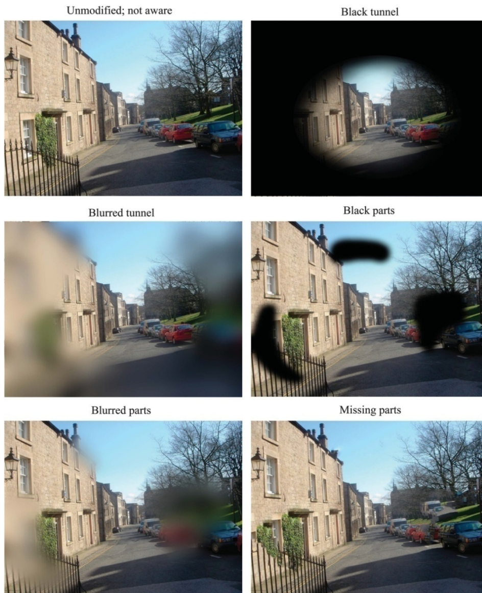
Slika 3 – fotografije simulacije oštećenja vidnog polja, korištene u istraživanju Crabb i sur. (2013, prema Crabb, 2016)

Tunelski vid i crnilo najčešći su, no ne i najbolji opisi vizualnih simptoma kod glaukoma. Simptomi više uključuju nedostajanje dijelova slike te zamagljena iskrivljenja (Crabb, 2016). U istraživanju u kojemu su se osobama s glaukomom pokazale fotografije s različitim prikazima bilateralnog gubitka vidnog polja (sl. 3.), najviše je osoba odabralo sliku na kojoj je gubitak vidnog polja prikazan kao zamagljenje dijelova slike ili nedostajanje dijelova slike. Zanimljivo je spomenuti kako je 25% ispitanika odabralo originalnu sliku, odnosno sliku na kojoj nije prikazano oštećenje vidnog polja usprkos tome što su te osobe imale umjereni bilateralni gubitak vidnog polja (Crabb i sur., 2013, prema Crabb, 2016). Mnoge osobe s glaukomom, čak s umjerenim gubicima vidnog polja, nisu svjesne svog oštećenja što može biti opasno i pogubno (Crabb, 2016).