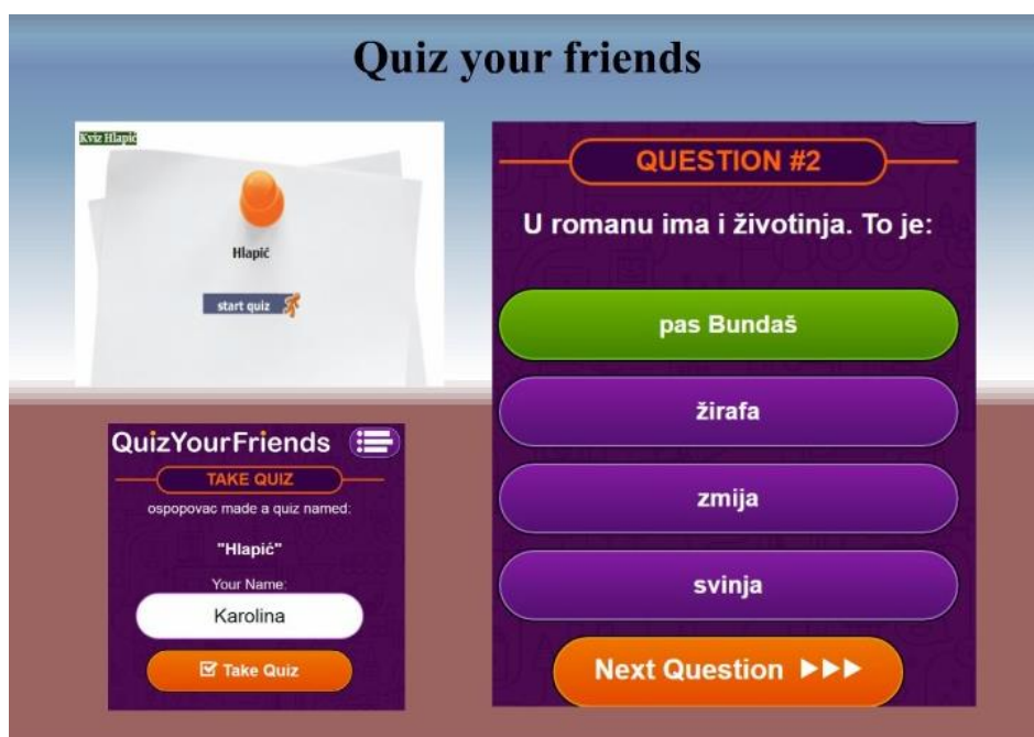
Slika 2. Quiz your friends