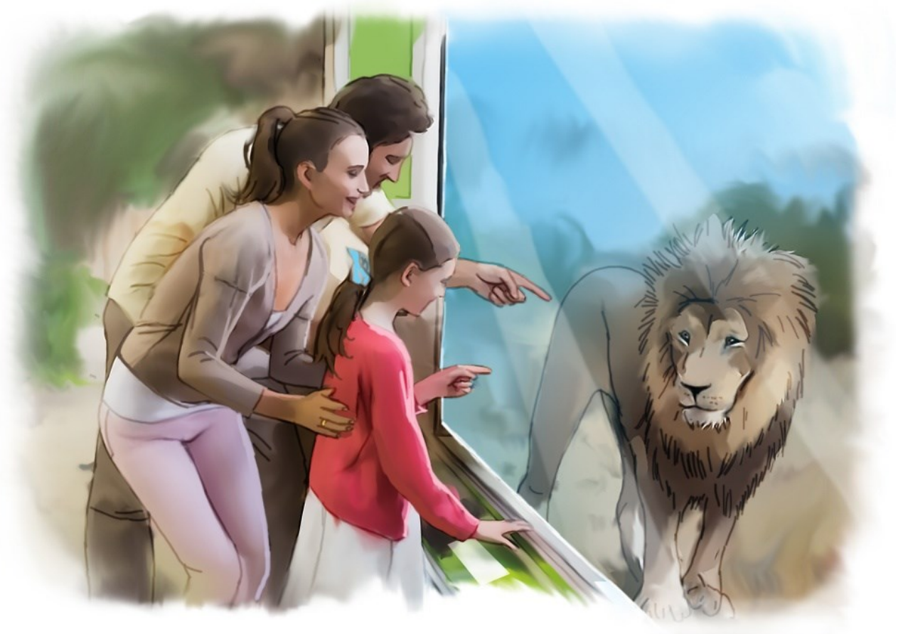
Slika 5. Poticanje komunikacije u prirodnom okruženju

Ovaj je program, kao i drugi Hanen programi, utemeljen na što ranijem uključivanju roditelja u intervenciju i poticanju komunikacije u prirodnom okruženju (Slika 5). Oslanja se na teorijske temelje Teorije uma koja objašnjava sposobnost razumijevanja tuđih misli i osjećaja.