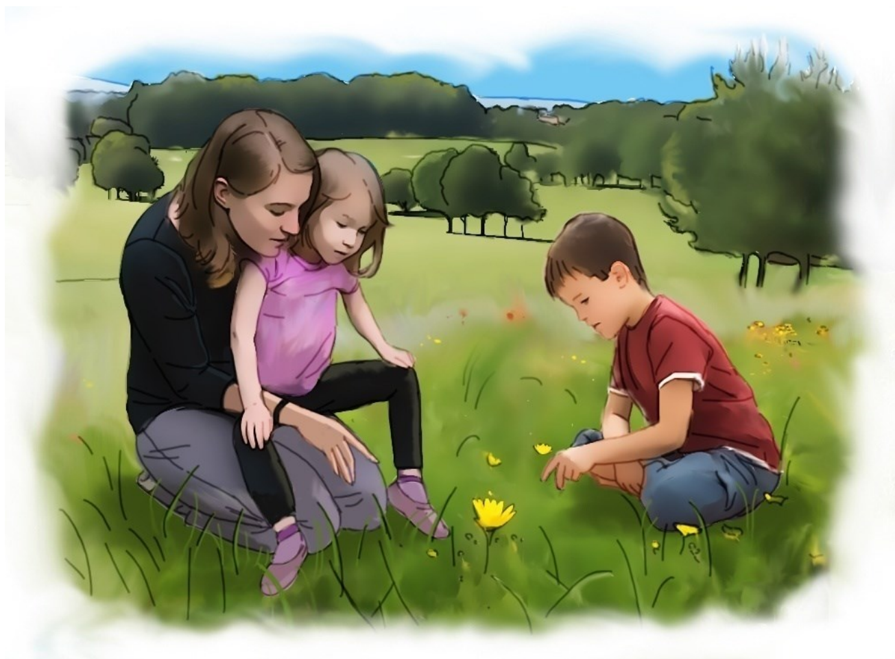
Slika 2. Usvajanje jezika u prirodnom okruženju

Roditelji se podučavaju vještinama kako na prirodan način kroz svakodnevne aktivnosti u prirodnom okruženju pomoći djetetu da usvaja jezik i poveća jezične kompetencije (Slika 2). Potrebno je značajno vrijeme posvećeno djetetu da bi se osigurali vidljivi rezultati u djetetovom razvoju. Jednom naučene strategije učenja mogu se trajno koristiti u interakciji s djetetom kao uobičajen način međusobnog ophođenja. Roditelji uče korak po korak kako biti dobar jezični model svom djetetu i kako ga podučavati materinjem jeziku.