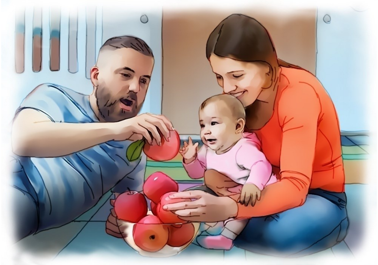
Slika 4. Korištenje trenutnog fokusa za usvajanje jezika

Preusmjeravanje djetetove pažnje s trenutnog interesa na ono što roditelj želi postići može biti frustrirajuće za dijete i tako se smanjuje motiviranost za učenje.