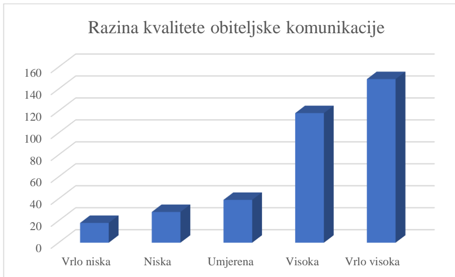
Graf 1. Prikaz razina kvalitete obiteljske komunikacije po kategorijama (od vrlo niske do vrlo visoke)

Olson, Gorall i Tiesel (2006) su u svom istraživanju na N=2.465 sudionika istraživanja, dobili nešto drugačije rezultate. Prosječna vrijednost je iznosila 36.2, standardna devijacija 9.0. Ispitujući pouzdanost skale računanjem Cronbachovog Alpha rezultata, navedeni autori dobili su rezultat 0.90, a slične rezultate dobili su i drugi autori: 0,94 (Craddock, 2001), 0,92 (Margasiński, 2015), 0,60 (Akhlaq, Iqbal Malik i Aslam Khan, 2013). Rezultati po kategorijama koje su dobili autori (Olson, Gorall i Tiesel, 2006) iznose 10% u kategoriji vrlo niske kvalitete, 14% u kategoriji niske kvalitete, 24% u kategoriji umjerene kvalitete obiteljske komunikacije, 24% u kategoriji visoke kvalitete, te 13% u kategoriji vrlo visoke kvalitete obiteljske kategorije, što se razlikuje od rezultata dobivenih u ovom istraživanju.