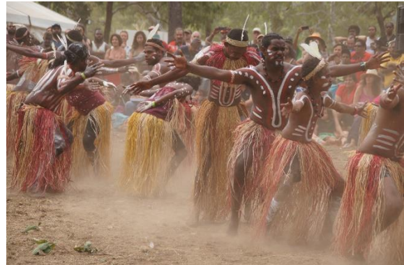
Slika 2. Prikaz plesnog rituala

U današnje vrijeme, moderan način života doveo je do većeg stresa u ljudi što je rezultiralo i većim otuđenjem osobe od zajednice, prirode ali i od samih sebe. U bližoj povijesti pa do danas, uloga plesa u društvu zadobila je formalni karakter te se više pažnje posvećivalo plesnoj tehnici nego li tome kako ples zapravo djeluje na pojedinca. Također, duh i tijelo sagledavani su kao dvije zasebne cjeline, neovisne jedna o drugoj. Tako je za tijelo preuzela ulogu medicina, dok se umom i mentalnim stanjima počinje baviti psihoterapija koja probleme pokušava riješiti isključivo razgovorom, bez korištenja pokreta tijekom terapije (Levy, 1988).