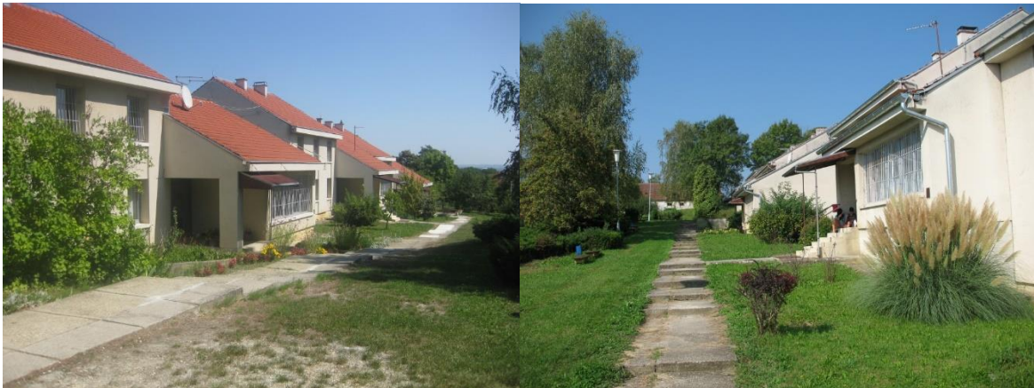
Slika 2. i 3. Izgled Odgojnog doma Bedekovčina prije procesa transformacije 8

Dana 10. lipnja 2021. godine posjetila sam osobno Odgojni dom Bedekovčina (u daljnjem tekstu: ODB). Svrha posjete je bila dobiti uvid u promjenu usluga i transformaciju ODB, kao i čuti osobne doživljaje i iskustva odgajatelja. ODB je danas ustanova socijalne skrbi sa sjedištem u Bedekovčini koja pruža uslugu organiziranog stanovanja uz sveobuhvatnu podršku na adresi Brestovec Orehovički 1/B za djecu bez odgovarajuće roditeljske skrbi od 7. do navršene 21. godine života. Na adresi Pustodol 94A pruža se usluga organiziranog stanovanja uz sveobuhvatnu podršku za djevojke s problemima u ponašanju od 14. do navršene 21. godine života. Ostale usluge koje se pružaju su: usluga poludnevnog boravka u školi, usluga poludnevnog boravka kod pružatelja usluga socijalne skrbi, usluga savjetovanja i pomaganja obitelji, usluga savjetovanja i pomaganja nakon izlaska iz skrbi te usluge stručna pomoć i potpora udomiteljskim obiteljima s područja Krapinsko – zagorske županije. Prije provedenog procesa transformacije ustanova, djevojke su bile smještene u tzv. „paviljonima“, velikoj sivoj zgradi s rešetkama na prozorima.