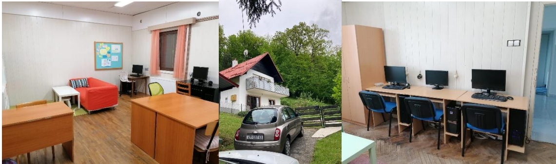
Slika 4., 5. i 6. Izgled Odgojnog doma Bedekovčina nakon procesa transformacije 9

Odgajatelji koji rade u Domu dugi niz godina opisuju da je situacija u instituciji prije transformiranja bila takva da su korisnici bili samo broj, nije postojao suživot odgajatelja i korisnika u istom prostoru, učenje životnih vještina i sl. Korisnice nisu mogle same birati odjeću koju će nositi ili hranu koju će jesti, a postojalo je osoblje koje obavlja poslove kuhanja i čišćenja. Sada odgajatelji s korisnicima čiste, provode slobodno vrijeme, kuhaju, uređuju okućnicu itd. Obišla sam većinu lokacija na kojima Dom djeluje te čula različita iskustva odgajatelja, pri čemu se svi slažu kako je nakon provedenog procesa transformacije bolji odnos između korisnika i odgajatelja, bolji uvjeti rada, smanjenje bjegova iz institucije, kao i nasilja među korisnicima i korisnika prema odgajateljima. Budući da je to prije procesa deinstitutionalizacije bio je to jedini odgojni dom koji je pružao usluge isključivo za djevojke s problemima u ponašanju u Hrvatskoj, na smještaj dolazi velik broj djevojaka sa psihijatrijskim dijagnozama, što smatraju najvećim izazovom u radu zbog njihovih specifičnih teškoća i vlastite needuciranosti rada s istima.