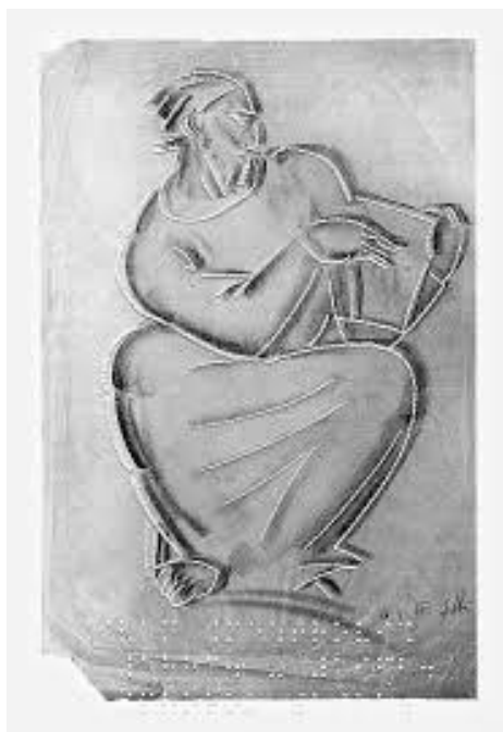
Slika 9: Razglednica s motivima meštovićevih crteža iz fundusa galerije Ivana Meštovića

Pet crteža Ivana Meštovića iz fundusa Galerije Ivana Meštovića izvedenih u dubokom tisku i popraćenih kataloškim opisom na Brailleovu pismu dio su mape koja je u sklopu projekta Dotakni i vidi Meštovićeve crteže - za Županijsku udruhu slijepih, Split, a uz obilježavanje Međunarodnog dana muzeja 2002. godine, izrađena u pet primjeraka. Projekt se nastavio izradom razglednica. Odabrani su jednostavni crteži naglašene linearnosti, s biblijskim motivima koji se ističu na neutralnoj podlozi papira. Oblici u kojima samo paralelne ili kose kratke linije sugeriraju dubinu i voluminoznost jasno su izdvojeni obrisnom linijom. Postupak izrade zahtijeva posebnu metodu. Razglednice se najprije tiskaju u offsetu, a zatim se dorađuju na sitotisku. Grafička priprema, osim standardne, zahtijeva i izradu linearnog crteža koji se zajedno s podacima o djelu na brajici, reljefno aplicira uz osnovni motiv (Šeparović Palada, 2005).