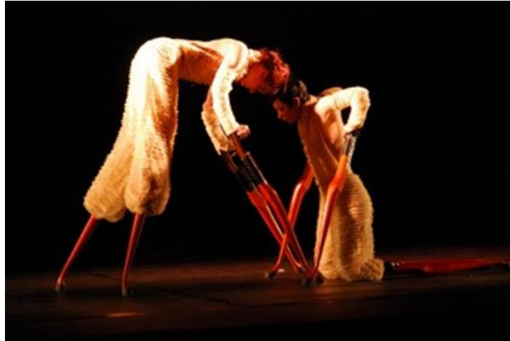
Slika 5: „Za drveno srce jedan dah je čitavo more“