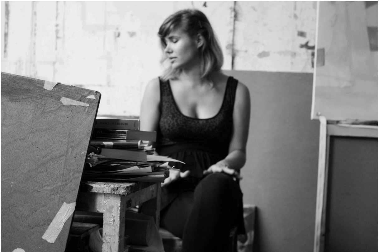
Slika 10: „Pogled na svakodnevicu iz sjedeće perspektive“ (Mrežni izvor: http://galerija.sczg.hr/ preuzeto 18. lipanj. 2016.)

Izložba je bila otvorena od 16.11.2015. do 30.11.2015. Pogled na svakodnevicu iz sjedeće perspektive predstavlja fotografije nastale na Akademiji likovnih umjetnosti, u studentskom domu te kod kuće. Fotografije su bile snimljene iz sjedeće perspektive pomoću upravljača te kamerom, pričvršćenom na stalak koji je bio montiran na invalidska kolica. Serija je predstavljena kao knjiga fotografija, koje su složene u diptihe.