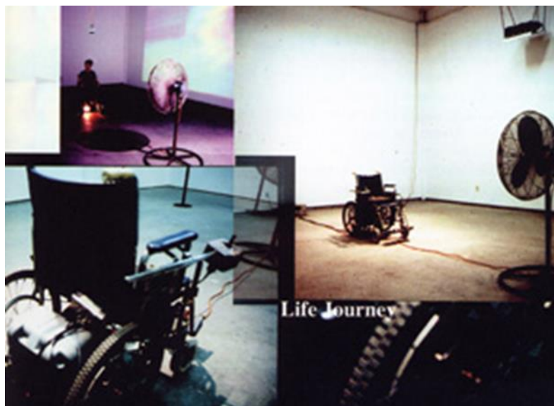
Slika 6: „Životni put“ (Izvor: Disability in the arts, Berge, 1997.)

njezinog uspjeha kao umjetnice. Jon K. Berge umjetnik je koji se bavio temom invaliditeta u svojim radovima, primjer toga je njegova instalacija "Životni Put" čiji je cilj bilo pružanje virtualnog iskustva za gledatelje. "Životni Put" interaktivna je instalacija koja direktno suočava gledatelja s ograničenjima invalidskih kolica (Berge, 1997). Djelo stavlja u kontrast nepokretnost sudionika dok sjedi nepomičan u stolici koja je pričvršćena za pod, s iluzijom brzog putovanja, kreirana uz pomoć projekcija na zidovima koji se nalaze na drugoj strani, uz zvukove pokreta i simulirani nalet vjetra uz pomoć podnog ventilatora (Berge, 1997).