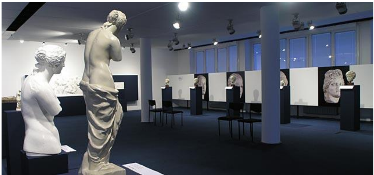
Slika 7: „Dodir antike“

Izložba „Dodir antike“ je početkom prosinca 2005. otvorila vrata izložbenog prostora Tiflološkog muzeja. Izložba se sastojala od dvadeset i tri izložka antičke umjetnosti, gipsane kopije ili kopije u sintetičkoj smoli te nešto reljefnih crteža. Prvi nizovi skulptura bili su postavljeni na postamentima, spojeni reljefnom podnom trakom, dok su dostupan tekst i legende bili na brajici (Vujić, 2005).