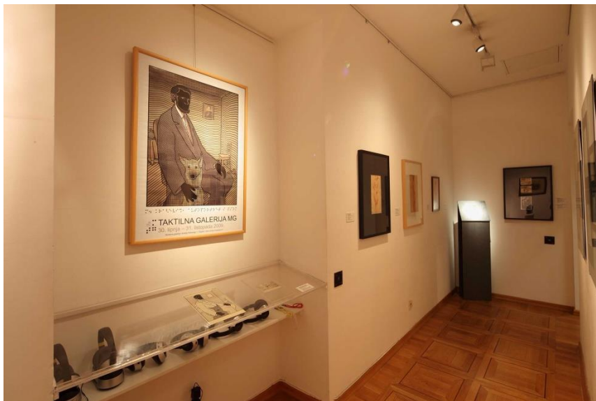
Slika 8: „Osma izložba Taktilne galerije MG“

Taktalna galerija u osmom postavu dodirnom i zvukom prezentirala je Autoportret sa psom Miroslava Kraljevića kao kapitalno djelo hrvatske slikarske Moderne, skulpturu Glava djevojčice (Portret Ivane Pacher) i Plaketu Tome Pl. Kraljevića.