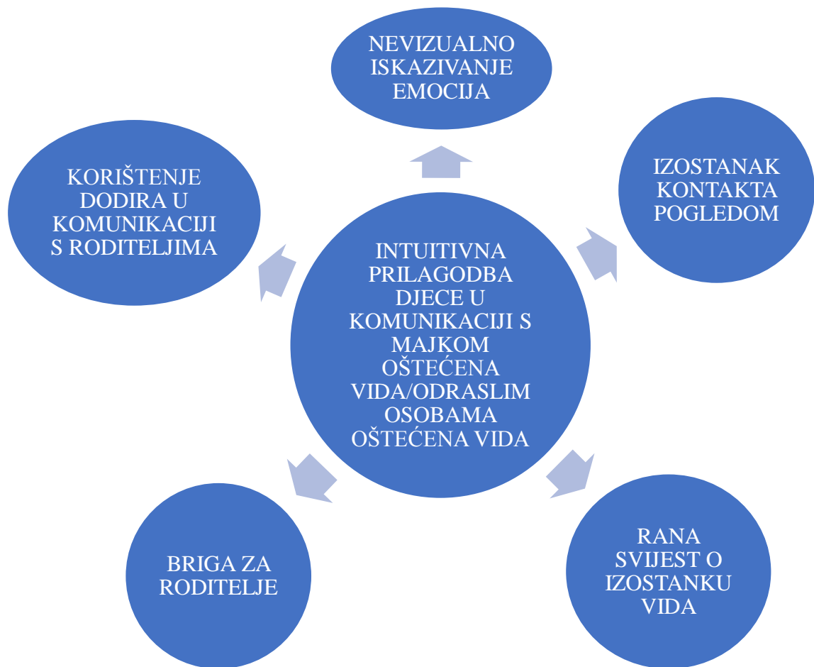
Dijagram br. 2

Dijagram broj 2 prikazuje načine na koje su se djeca intuitivno prilagodila oštećenju vida svojih roditelja prilikom komunikacije s njima, ali i intuitivnu prilagodbu djece iz njihove okoline u komunikaciji s odraslim osobama oštećena vida.