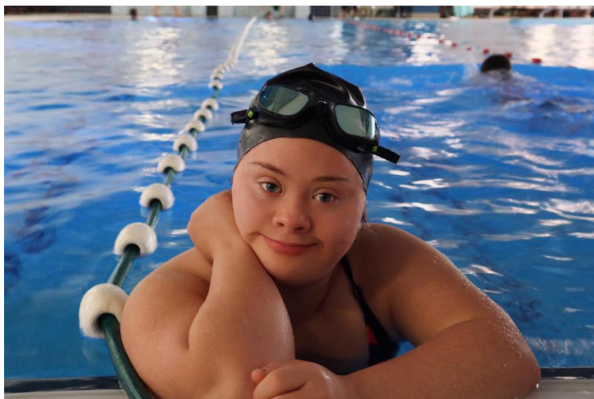
Slika 1. Djevojka s Down sindromom