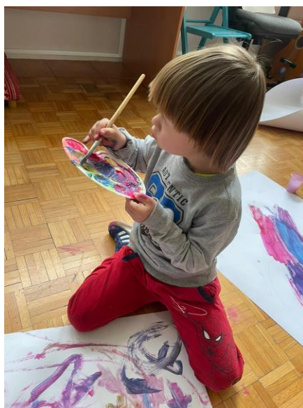
Slika 10. Bojanje siluete (2.sudionik)

Svaki sudionik je svoju siluetu tijela bojava s vodenim bojama. Nakon što su stariji sudionici obojili svoje siluete priključili su se manjim sudionicima i pomogli im bojati njihove siluete.