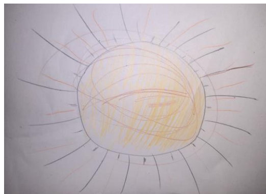
Slika 7. Sunce

Slika 6. i slika 7. predstavljaju crteže glavne aktivnosti likovne radionice. Obje slike prikazuje bojanje sudionika u paru.