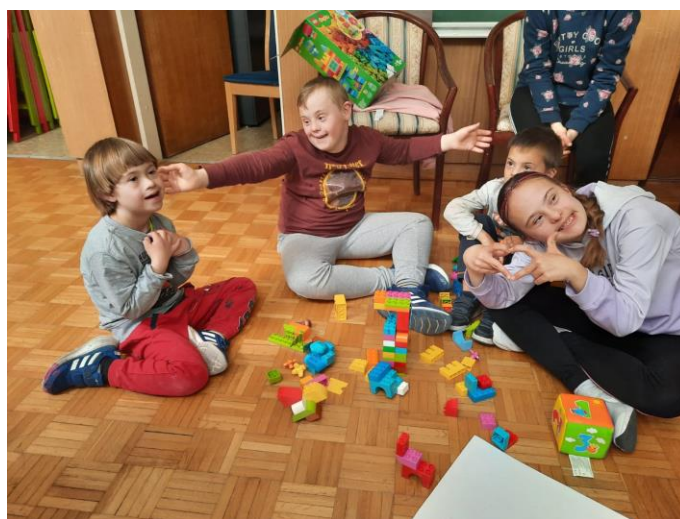
Slika 15. Zajednička fotografija sudionika