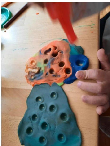
Slika 13. Plastelin

Ovu radionicu smo završili slobodnom igrom. Neki od sudionika su radili s plastelinom, slagali puzzle i ponavljali slova te radili tornjeve od lego kockica.