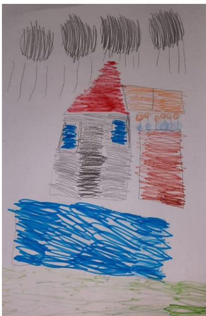
Slika 2. Slobodni Crtež - Kuća

Na slici je prikazan crtež dječaka M. koji ima 11.godina. Pomoću crteža dječak je prikazao što voli. Crtao je svoju kuću s bazenom. U njoj voli boraviti. Osim verbalizacije crtež je prikazivao i gestama (mala kuća, plivanje).