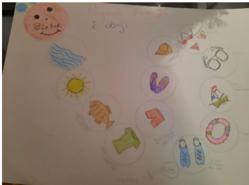
Slika 5. Primjer gusjenice “Pogodi što je i oboji”

Glavna aktivnost ove radionice je gusjenica “Pogodi što je i oboji “. Gusjenica se sastojala od dvanaest polja koji prikazuju pojmove vezane za godišnje doba koje nam dolazi - Ljeto. Svako polje je imalo svoju zadaću. Primjer: Ti oboji, odaberi prijatelja koji će bojati umjesto tebe/s tobom. Kroz ovu aktivnost se poticala socijalizacija, komunikacija, učenje brojeva i pojmova vezana za godišnje doba Ljeto.