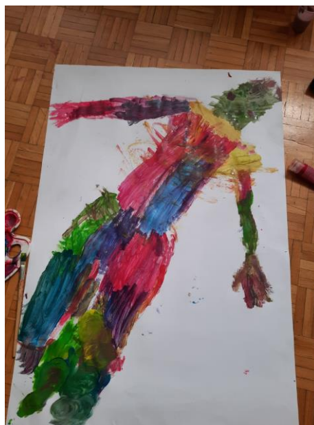
Slika 12. Šarena Silueta