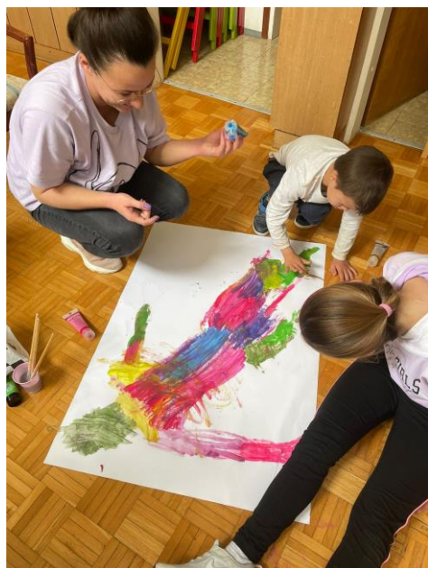
Slika 11. Grupno bojanje Siluete

Svaki sudionik je svoju siluetu tijela bojava s vodenim bojama. Nakon što su stariji sudionici obojili svoje siluete priključili su se manjim sudionicima i pomogli im bojati njihove siluete.