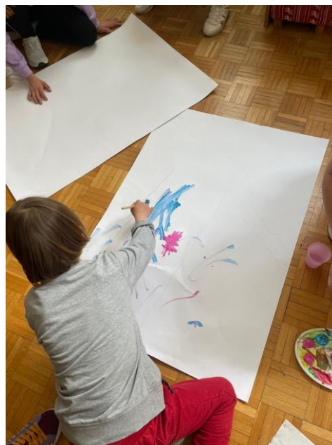
Slika 9. Silueta tijela (2. sudionik)