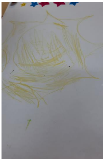
Slika 3. Sunce

Sudionici su se prvo samostalno pokušavali sjetiti što je koje boje (postavljala sam im pitanja, usmjeravala ih prema pravom odgovoru). Kada se nisu mogli sjetiti koji je oblik nacrtan i koje je boje ponudila bi im slikovni prikaz predmeta koji su žute, plave, crvene ili zelene boje. Kroz crtanje sudionike se poticalo na zajedničko sudjelovanje i komunikaciju.