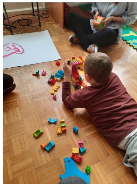
Slika 14. Lego kockice

Slika 13. i slika 14. prikazuju aktivnosti koje su djeca odabrala za kraj radionice.