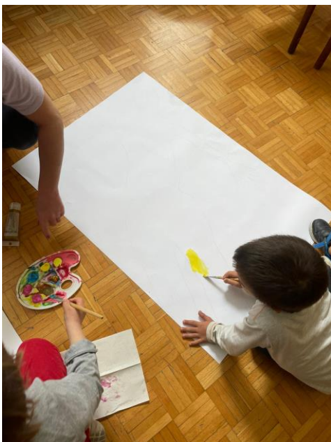
Slika 8. Silueta tijela (1.sudionik)

Početak radionice je započeo razgovorom o tome kako su proveli dan. Uz pomoć volonterke svakog sudionika sam iscrtala na velikom bijelom hameru.