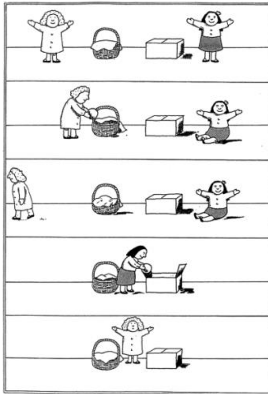
Slika 6. Zadatak netočnih uvjerenja „Sally-Ann“ (Tager-Flusberg, 2007).

Većina djece odgovorit će da će Sally tražiti ondje gdje se stvarno nalazi, a ne ondje gdje ju je ostavila. Na temelju ovog odgovora Simon Baron-Cohen zaključio je kako djeca sa PSA-om ne mogu shvatiti kako druge osobe razmišljaju, a ni povezati uzročno-posljedične veze. Ono što je kod ove djece u navedenom zadatku bodovano kao prolaz je pokazivanje na košaru i točan odgovor za pitanje stvarnosti (tj. "Gdje je igračka zapravo?") i pitanje pamćenja (tj. "Gdje je igračka bila na početku?"). Djeca urednog razvoja u dobi od četiri godine prolazi ovaj zadatak netočnih vjerovanja, dok djeca sa PSA-om u dobi od četiri/pet godina obično ne uspijevaju (Sengupta i Mohakud, 2014).