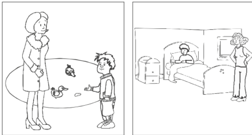
Slika 2. Prikaz zadatka razlikovanja fizičkih i mentalnih entiteta (Blijd-Hoogewys, 2008).