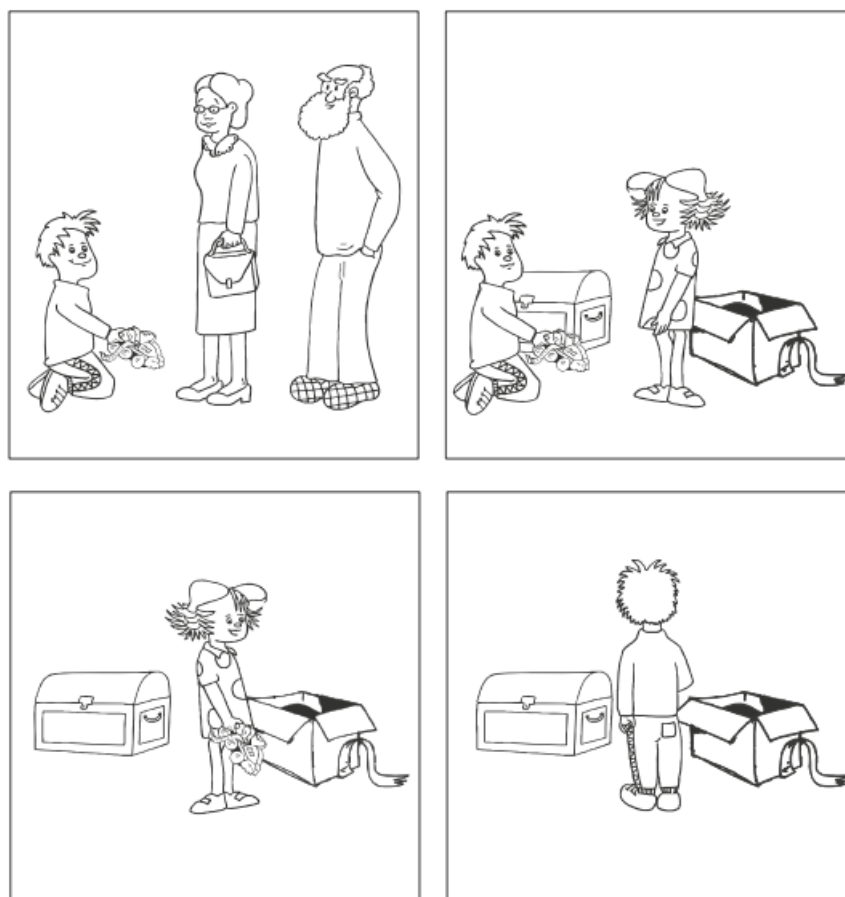
Slika 5. Zadatak netočnih uvjerenja (Blijd-Hoogewys, 2008).

Većina istraživanja usredotočena su na prijelazno razdoblje kad djeca počinju razumijevati netočna vjerovanja, oko četvrte godine života (Škrobo i sur., 2016). Poteškoće u standardu razumijevanja teorije uma se kod osoba sa PSA-om tradicionalno ispituje pomoću zadataka prvog i drugog reda "netočnih vjerovanja" (Dennett 1978).