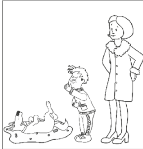
Slika 3. Prikaz zadatka „bliskog lažnjaka“ (Blijd-Hoogewys, 2008).