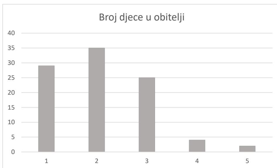
Grafikon 1: Prikaz broja djece u obitelji

Istraživanjem su obuhvaćeni roditelji raznih stupnjeva školske spreme: osnovno obrazovanje (N=2), strukovno obrazovanje (N=2), trogodišnje strukovno obrazovanje (N=22), gimnazijsko srednjoškolsko ili četverogodišnje i petogodišnje strukovno srednjoškolsko obrazovanje