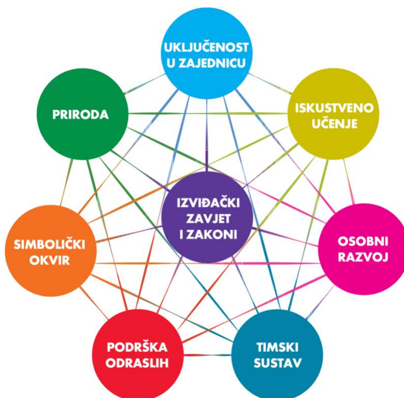
Slika 1. Elementi Izviđačke metode (WSB, 2019)

Jedan od osnovnih elemenata skautizma, specifičan isključivo za Izviđački pokret i jedinstven u nacionalnim organizacijama u cijelom svijetu (Roglić, 2013), jest Izviđačka metoda . Izviđačka metoda je odgojno-obrazovna metoda na kojoj se temelje sve izviđačke aktivnosti, a koja se sastoji od osam međusobno povezanih elemenata: sustav vrijednosti (izviđački Zavjet i zakoni), iskustveno učenje, osobni razvoj, timski sustav, podrška odraslih, simbolički okvir, priroda i uključenost u zajednicu. Kako navodi Behek (2000), Izviđačka metoda je doživljajna pedagogija u praksi. Povezanost pojedinih elemenata metode slikovito je prikazana na slici 1.