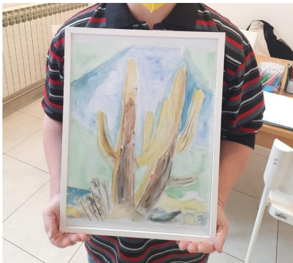
Slika 2. Z.K. „Kaktusi“

Exchange Project ) koja je održana u Koreji. Također, sudjelovao je i na izložbi likovnih radova „Crtež kao medij“ u Muzeju suvremene umjetnosti te na izložbi „Drugačiji i jednaki – umjetnost i inkluzija“ također u suradnji s Muzejom suvremene umjetnosti. Njegovo najveće postignuće do sada, je prolazak na natjecanju za nacionalnu izložbu akvarela, Deveti hrvatski trijenale, s radom „Kaktusi“ te je njegov rad izložen na izložbama u Karlovcu, Slavonskom Brodu te Zagrebu. Također, o Z. i njegovom životu i talentu je napravljen prilog u emisiji „Mir i dobro“ te u IN magazinu.